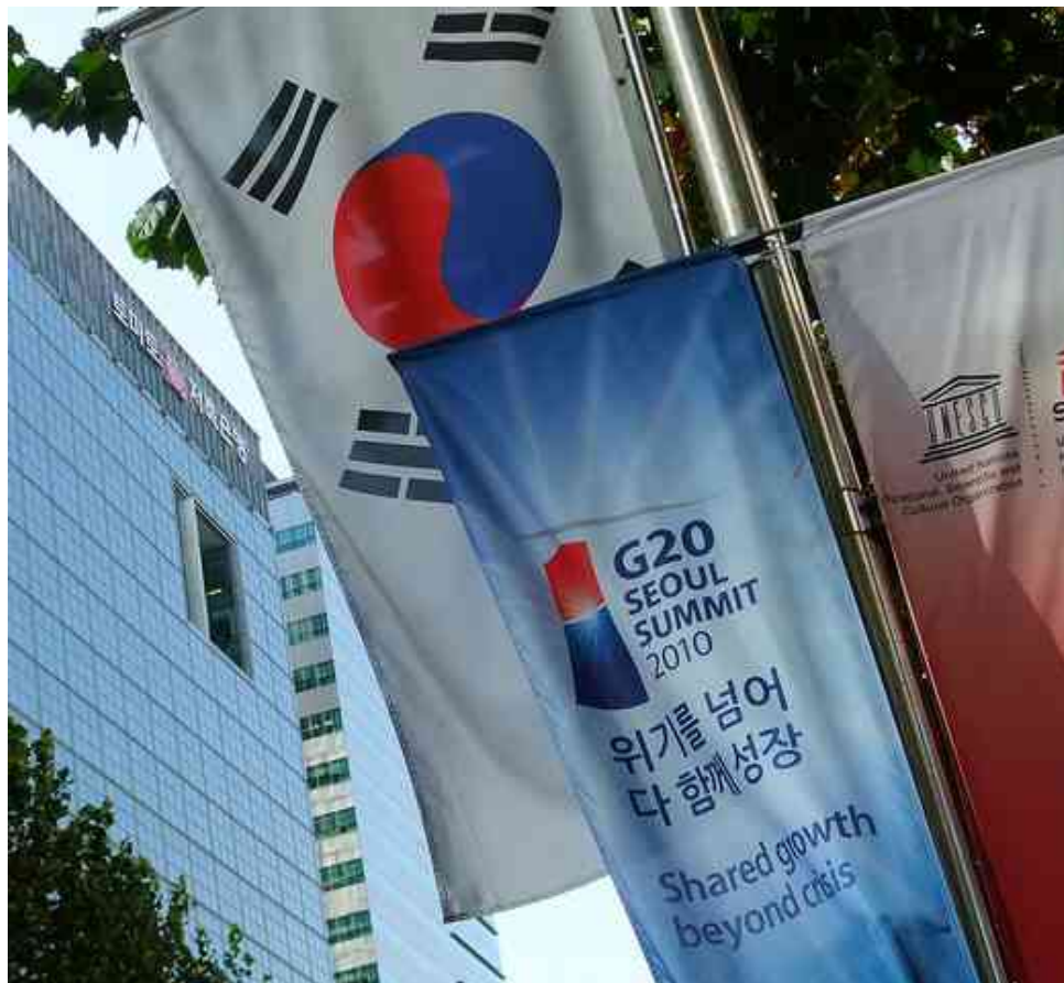
G20 à Seoul (2010)