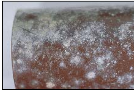
Développement fongique sur un cylindre en cire