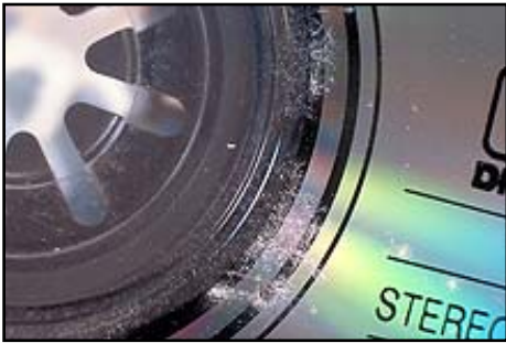
Développement fongique sur un CD

Les micro-organismes, en particulier les moisissures, peuvent se développer sur un grand nombre de supports :