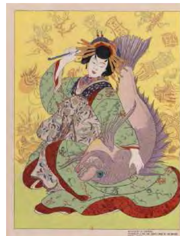
Ebi Su, dieu du bonheur, personnifié par une courtisane du Shimabara Kyoto, Japon Paul Jacoulet