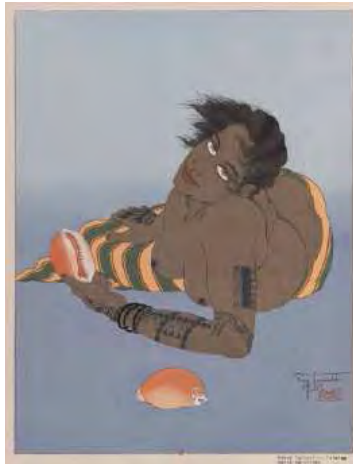
Femme tatouée de Falalap Ouest Carolines Paul Jacoulet © ADAGP, 2011 BnF, dpt des Estampes et de la photographie