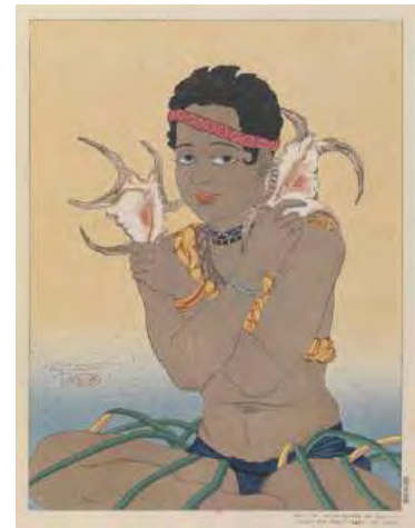
Basilio, jeune garçon de Saipan tenant des coquillages Paul Jacoulet © ADAGP, 2011 BnF, dpt des Estampes et de la photographie