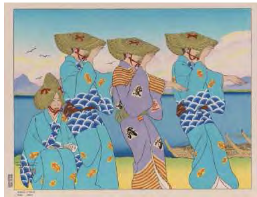
Danse d'Okesa Sado, Japon Paul Jacoulet © ADAGP, 2011 BnF, dpt des Estampes et de la photographie