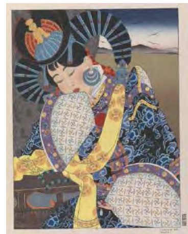
L'Étoile de Cobi Mongolie Paul Jacoulet © ADAGP, 2011 BnF, dpt des Estampes et de la photographie