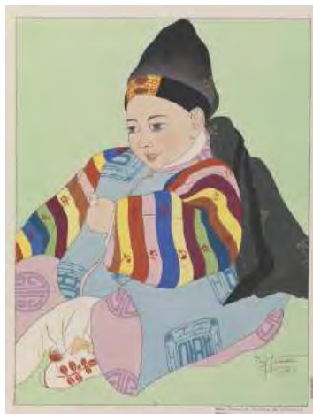
Bébé en costume de cérémonie Séoul Paul Jacoulet © ADAGP, 2011 BnF, dpt des Estampes et de la photographie