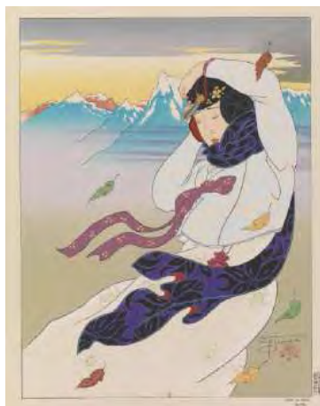
Vent du Nord Corée Paul Jacoulet © ADAGP, 2011 BnF, dpt des Estampes et de la photographie