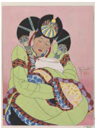
Le remplaçant Paul Jacoulet © ADAGP, 2011 BnF, dpt des Estampes et de la photographie