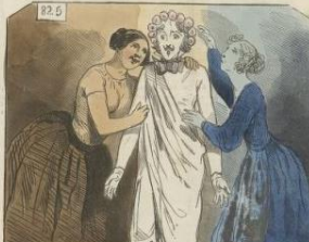
A Indemnités, obtenu petit par Lapointe et obtenu par-dessus la tête. Les poules braves valent-elles mieux que les petites blanches? La mode de M. Lapeyre veut-elle mieux que son dessin? Il y a indemnité.