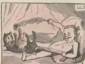
Monsieur d'opinion, Monsieur, j'aurais aimé un accident de la vase d'opinion, par M. Raab. Dans l'attente de ce que de ce, même les chaires. C'est ce que M. Raab, a su rendre à merveille. Ce tableau peut rendre un effet de grande allure.