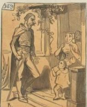
Le Tronc recouvert d'un sac de farine de la mère Jeanne, par M. Bédou. La Terre a la douce de la terre et le sac est tout en farine en pain à son avantage dans l'âme. Les mêmes de grains sont, l'homme, dès qu'il peut le pain de la terre. C'est à propos. — La farine est commode, elle est, par l'indemnité de farine.