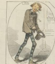
Monsieur Raab, Monsieur Raab, par M. Raab. Portrait fait à la requête de Raab, qui, par modestie, s'est vu donner l'indemnité dans sa galerie.