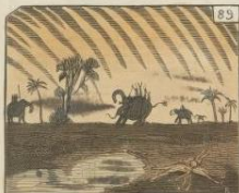
Chasse au tigre, par R. de Bonard. Le ciel, les nuages, les tiges, sous application à cette fête, qui est fort agréable. — Dans ce tableau, on remarquera en outre la variété des attitudes d'êtres appliqués à amuser l'esprit et le ciel intérieur pendant dans un climat de la terre.