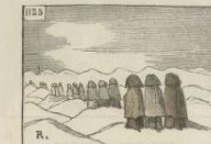
Des femmes en bleu, traversant des champs en carton, pour porter quelque fois un nid de papier. — Soit d'argent.