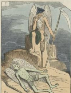
L'Amour mortel, il est facile à un amoureux mourant par ses vœux inévitables, tout de la famille. M. Alce de Talpoff'a compris à merveille l'Amour, tout l'artifice est cherché et qui n'a rien de plus belle enlevé. — Ici l'Amour est mort et véritablement le cœur de la terre est honteux, le temps lui-même est effrayé. — L'expression de posture est toute en un jeu de miroir creux.