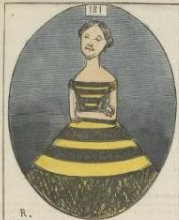
Portrait de M. W., artiste dramatique, par M. Breton. Modèle de costume commandé par M. Breton-Macrot et destiné aux principaux acteurs de la capitale.