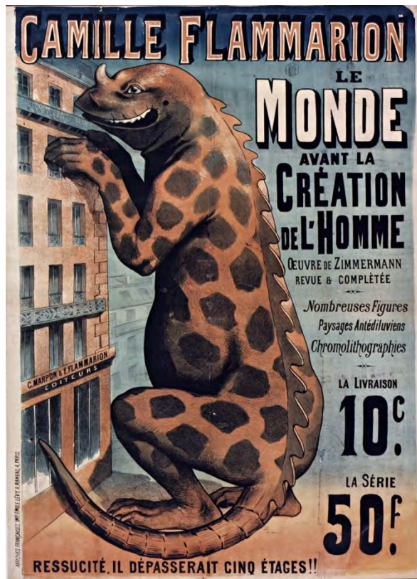
Camille Flammarion, Le monde avant la création de l'homme , 1885

Le monstre est, pour Aristote ou saint Augustin, un être qui s'écarte de la norme. En latin, monstrum vient du verbe signifiant montrer, avertir. Il se rapporte aux prodiges. Le monstre est alors un signe à interpréter : bon ou mauvais présage ? Nous laisserons de côté ici les créatures fabuleuses (dragon, chimère, Léviathan...) pour nous concentrer sur les monstres réels ou possibles.