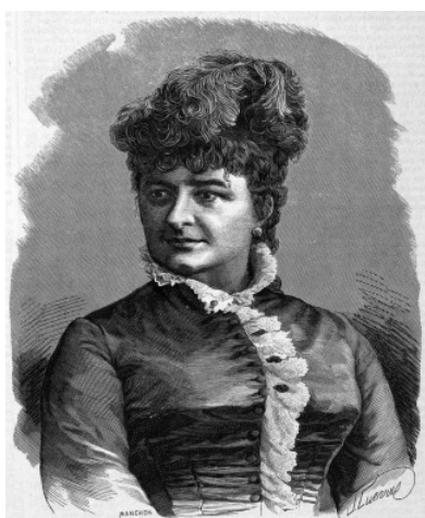
Emilia Pardo Bazán