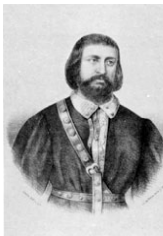
Pero López de Ayala

Cette bibliographie sélective regroupe les références, issues du programme officiel de l'agrégation externe d'espagnol 2019 (publié le 6 avril 2018 et modifié le 16 avril 2018, disponible à l'adresse : http://media.devenirenseignant.gouv.fr/file/agregation_externe/78/1/p2019_agreg_ext_lve_espagnol_934781.pdf ), et disponibles à la Bibliothèque nationale de France. Ces références ainsi que d'autres ressources bibliographiques complémentaires sont consultables en libre accès en bibliothèque du Haut-de-jardin et en bibliothèque de recherche (Rez-de-jardin). Certaines publications sont disponibles dans les collections patrimoniales conservées en magasins et consultables en Bibliothèque de recherche (Rez-de-jardin).