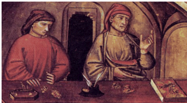
Représentation d'un comptoir de change, Toscane, anonyme du XIVe s.