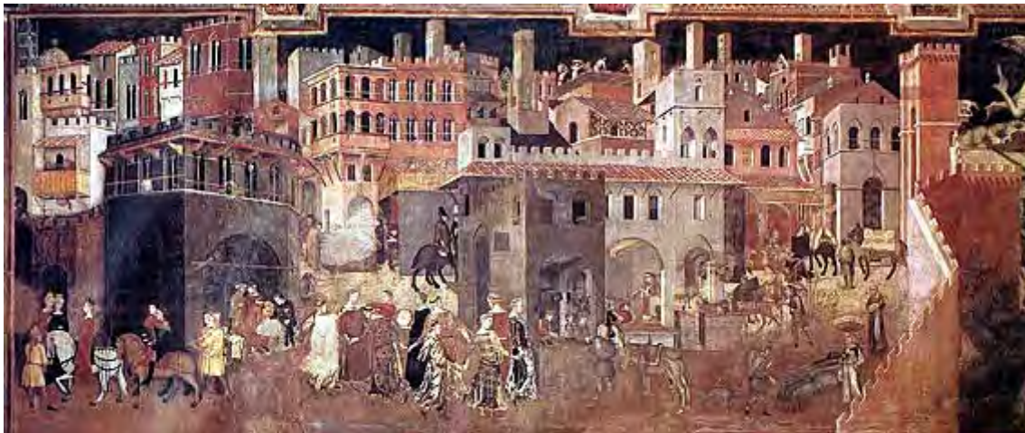
Ambrogio Lorenzetti, « Gli esiti del buon governo », Sienne, vers 1337-40

Tout au long du XIIIe siècle, et jusqu'à la moitié du XIVe siècle, avec une nette reprise au XVe, la péninsule italienne connaît un essor économique et artistique exceptionnel qui forge à jamais les traits de sa singularité.