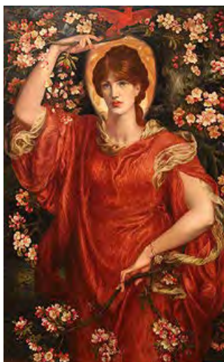
Fiammetta, vue par Dante Gabriel Rossetti