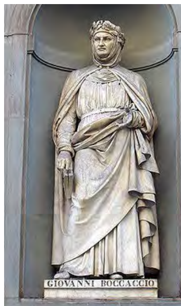
Statue de Boccace du Piazzale des Offices à Florence

À l'occasion de la commémoration du sept-centième anniversaire de la naissance de Boccace, la Bibliothèque nationale de France propose une double bibliographie sélective, réalisée par le département Littérature et art d'une part, pour les aspects littéraires, et par le département Philosophie, histoire, sciences de l'homme d'autre part, pour la mise en perspective historique de l'écrivain dans son époque et son pays. Cette bibliographie en deux parties accompagne des présentations d'ouvrages, en salle G (littératures étrangères) et J (philosophie et histoire).