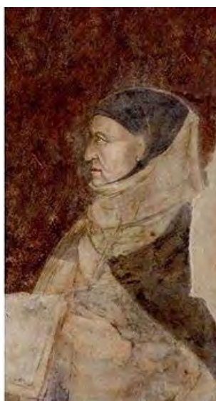
Portrait de Boccace du XIVe siècle

Jean Boccace – Giovanni Boccaccio de son nom italien naît en 1313 à Florence ou à Certaldo, ville où il meurt en 1375.