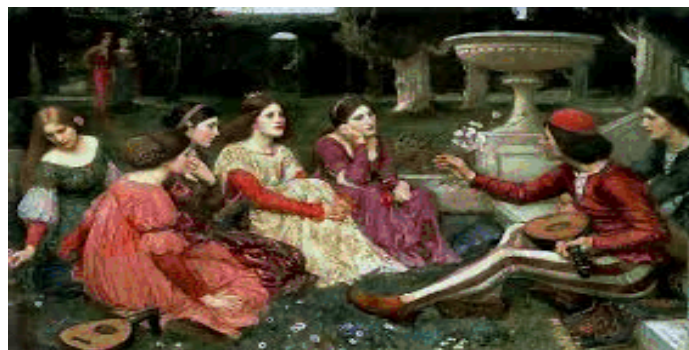
J. William Waterhouse, "A tale from Decamerone", 1916