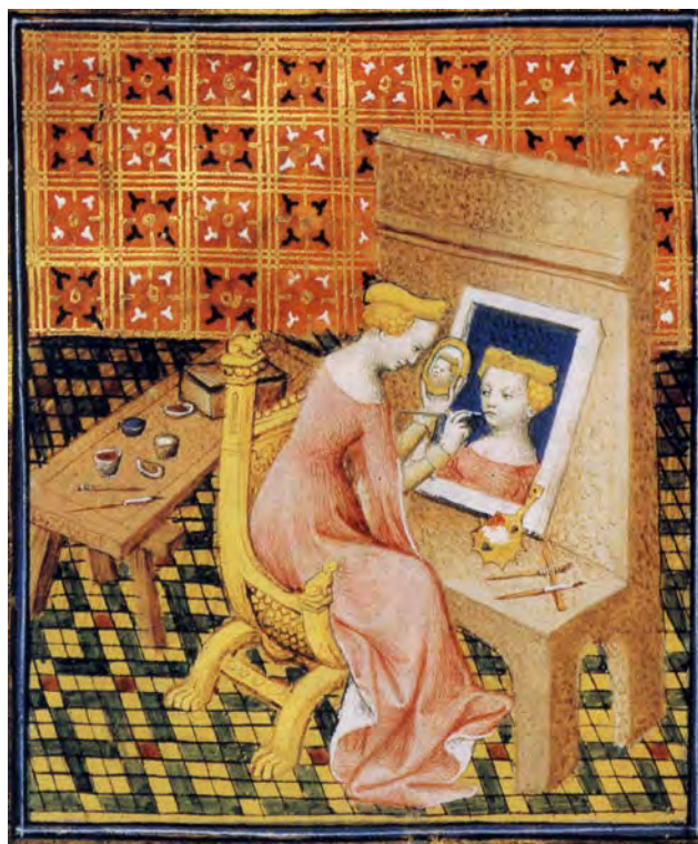
La peintresse Marcia, miniature de Philippe le Hardi