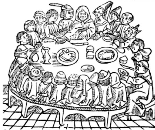
Illustration des Contes de Canterbury de Chaucer (1340–1400), gravure sur bois de 1484