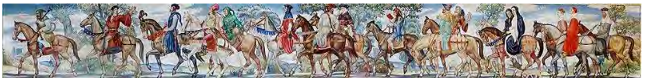
Winter, Ezra : Fresque illustrant les personnages des Contes de Canterbury de Geoffrey Chaucer.