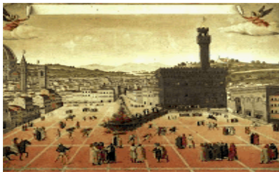
« Piazza della Signoria », Florence, peinture du XVe siècle