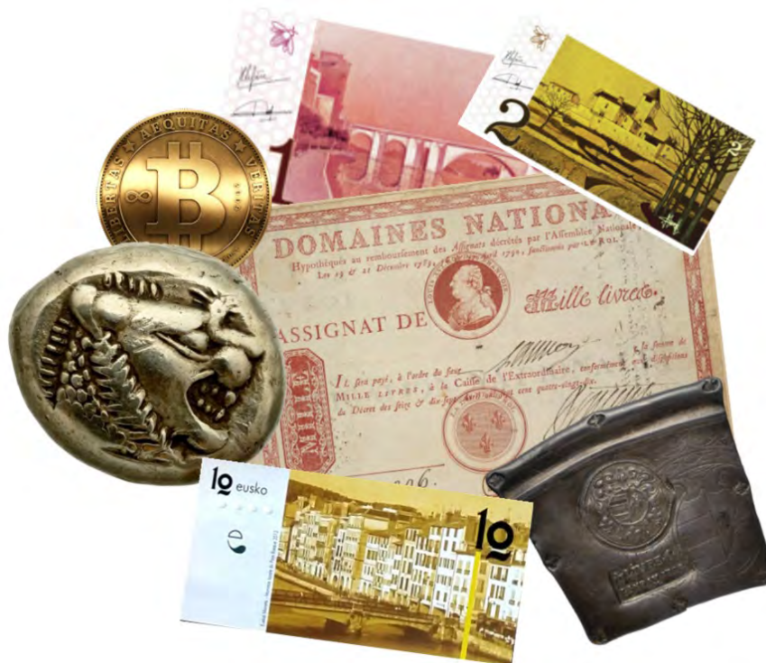
Différents instruments monétaires

Ces dernières décennies ont vu se multiplier dans de nombreux pays quantité de monnaies parallèles ayant cours sur un territoire donné et/ou entre des personnes d'une même communauté.