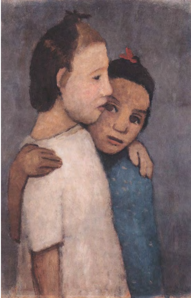
Paula Modersohn-Becker Zwei Mädchen in weißem und blauem Kleid – 1906

« Les enfants qui créent directement à partir du mystère de leurs sentiments, ne sont-ils pas plus créateurs que l'imitateur des formes grecques ? » August Macke, Almanach du Blaue Reiter , 1912