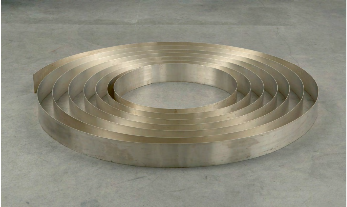
Carl Andre, Silver Ribbon , 2002 : © the artist, courtesy Sadie Coles HQ, London

« Minimal signifie pour moi la plus grande économie pour atteindre la plus grande fin ». Carl Andre (Parsy, 1992)