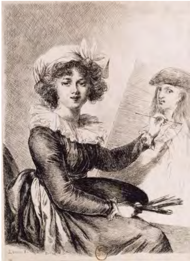
Autoportrait d'Elisabeth Vigée-Lebrun gravé par Vivant Denon, vers 1791