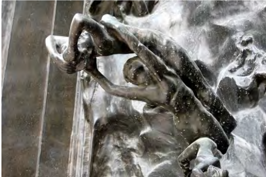
La Porte de l'enfer (détail). Rodin, Musée Rodin

À la fin du XIXe siècle, la sculpture connaît avec Rodin une liberté de formes jamais égalée. Tout en restant fidèle à la représentation du sujet, il introduit dans l'œuvre sensualité et puissance par une recherche d'équilibre audacieux entre la masse brute de la matière et l'élan irrésistible de la forme qui semble vouloir s'en échapper, donnant parfois l'impression d'être inachevée. En s'affranchissant ainsi de la tradition établie, il affirme les droits de l'artiste à considérer son œuvre en fonction de l'objectif artistique qu'il s'est lui-même fixé, alors que pour le public de l'époque, la perfection artistique était liée à une exécution minutieuse et figulée selon les règles de l'Académie.