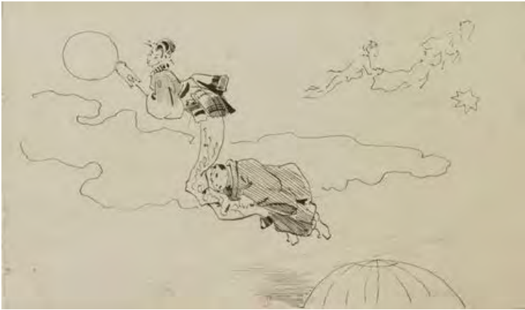
Deux japonais volants, Henry Somm, dessin à la plume, vers 1880

Cette bibliographie est disponible également en ligne sur le site internet de la BnF : Collections > Aide à la recherche > Bibliographies > Art