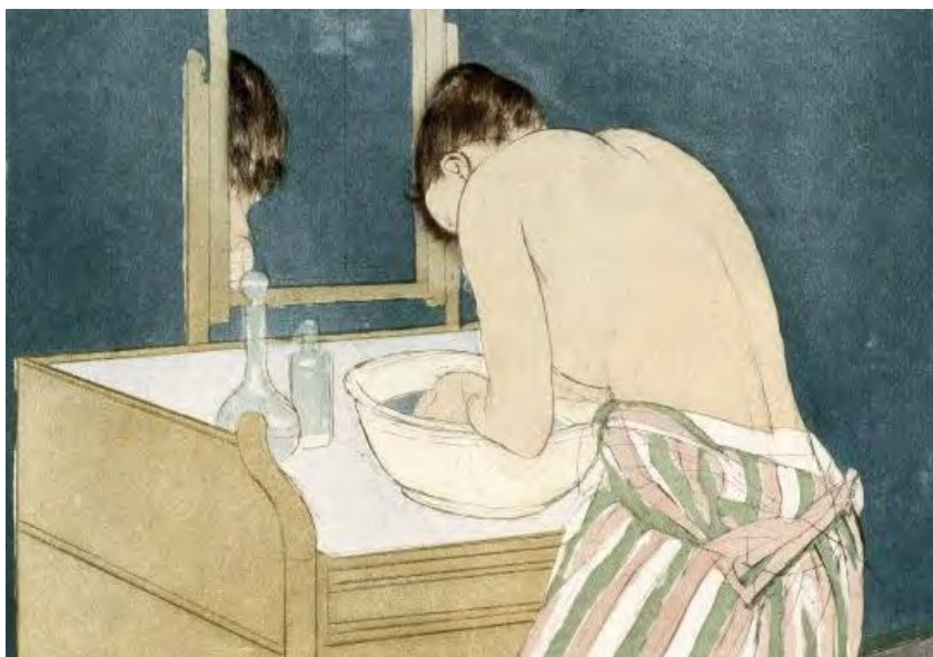
Mary Cassatt, La Toilette , 1890-1891 (Brooklyn Museum, New York)

De l'Impressionnisme à l'Art déco (1860-1940)