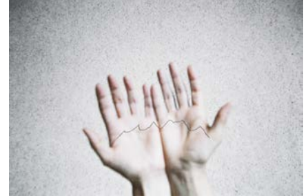
La frontière