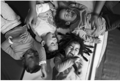
Homegrown | The people could fly