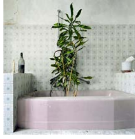
Les rideaux tombent