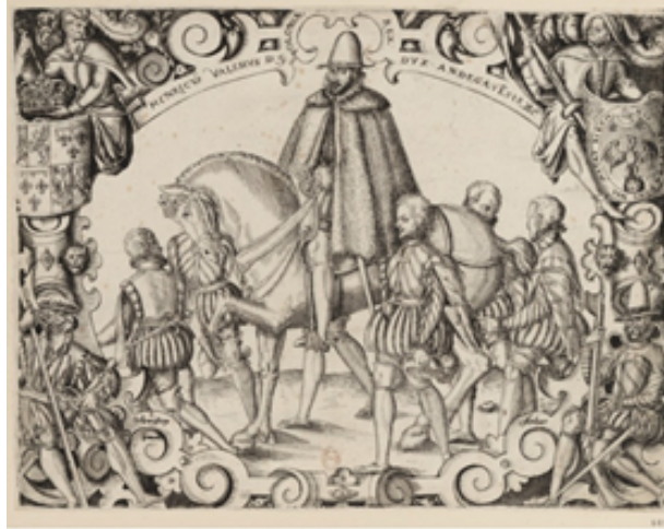
Henri de Valois, duc d'Anjou partant pour la Pologne : [estampe].

L'élection d'Henri de Valois (Henryk Walezy) au trône de la Rzeczpolitika de Pologne-Lituanie sous le nom d'Henri de Valois (Henryk Walezy) fait l'objet d'une abondante correspondance diplomatique conservée à la Bibliothèque nationale de France.