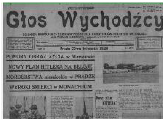
Głos Wychodźcy

Héritier de Watteau et de Rembrandt, Jean-Pierre Norblin de la Gourdain est le peintre emblématique du siècle des Lumières en Pologne. Peintre de la noblesse, il immortalise également l'ensemble de la société de Pologne-Lituanie ainsi que le soulèvement de Varsovie de 1794 consécutif au deuxième partage de la Pologne en 1792, l'une des pages tragiques de l'histoire de la Pologne. Naturalisé polonais, il passera près de trente ans en Pologne avant de rentrer en France en 1804.