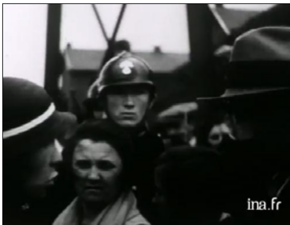
L'expulsion des familles polonaises à Leforest en 1934, TF1 (Collection: Les Mémoires de la mine ), Ina.fr

L'élection d'Henri de Valois (Henryk Walezy) au trône de la Rzeczpolitika de Pologne-Lituanie sous le nom d'Henri de Valois (Henryk Walezy) fait l'objet d'une abondante correspondance diplomatique conservée à la Bibliothèque nationale de France.