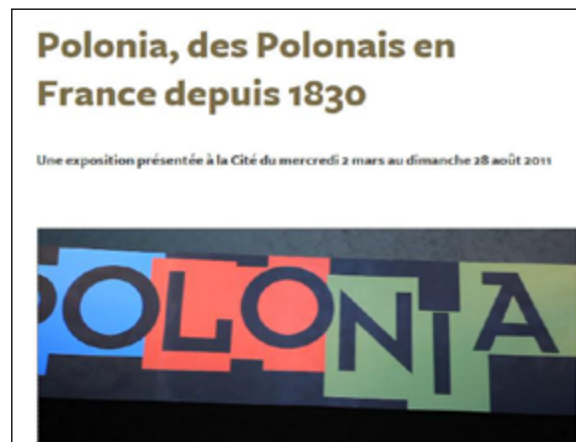
Exposition Polonia, Musée national de l'histoire de l'immigration

L'immigration économique de l'Entre-deux guerres se distingue de la Grande émigration du 19 e siècle de par son ampleur et son caractère ouvrier. Si Paris est considérée comme la deuxième capitale de la Pologne, des petites Polognes se multiplient dans les bassins miniers en particulier dans le Nord et l'Est de la France. Cette immigration donne lieu à une abondante presse d'immigration conservée à la BDiC. L'immigration polonaise s'illustrera dans la Résistance durant la Seconde Guerre mondiale comme en témoigne la presse clandestine conservée à la BnF.