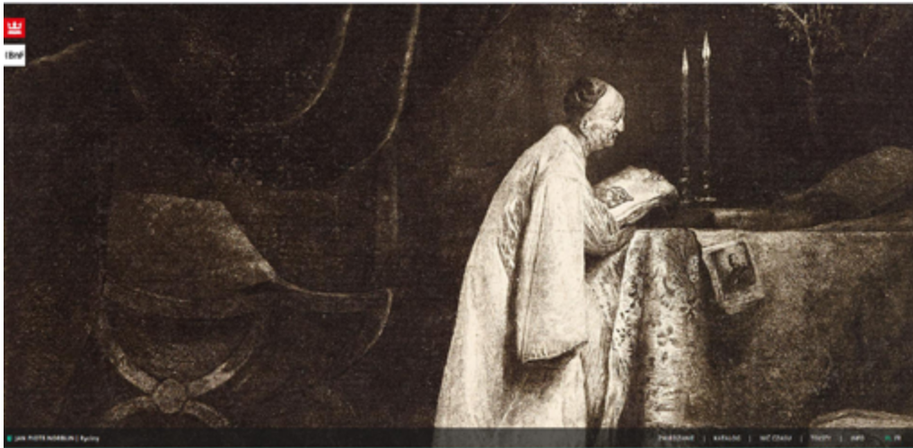
Exposition virtuelle sur le peintre Norblin de la Gourdain, Bibliothèque nationale de Pologne

Héritier de Watteau et de Rembrandt, Jean-Pierre Norblin de la Gourdain est le peintre emblématique du siècle des Lumières en Pologne. Peintre de la noblesse, il immortalise également l'ensemble de la société de Pologne-Lituanie ainsi que le soulèvement de Varsovie de 1794 consécutif au deuxième partage de la Pologne en 1792, l'une des pages tragiques de l'histoire de la Pologne. Naturalisé polonais, il passera près de trente ans en Pologne avant de rentrer en France en 1804.