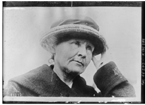
Mme Marie Curie : [photographie de presse]