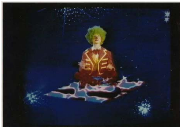
Electronique Vidéo Circus (1984) - © Michel Jaffrennou Centre culturel Georges Pompidou / Ville d'Orléans / BnF