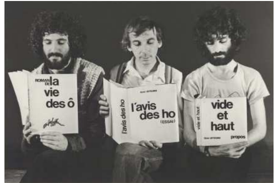
La vie des ô, l'avis des ho, vide et haut (1979)