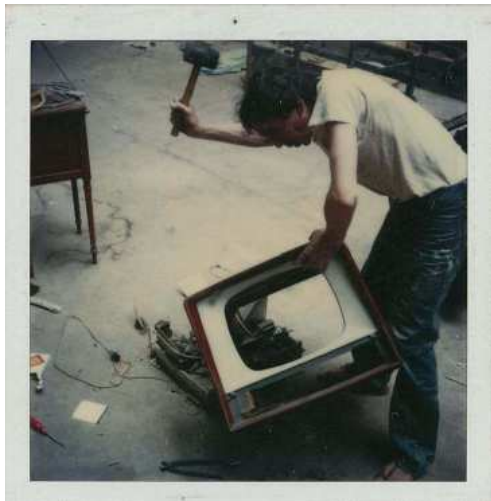
Chantier interdit au public (1980)