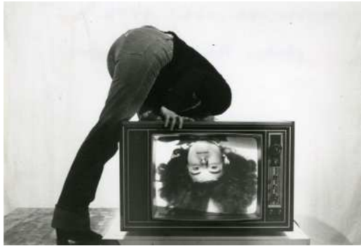
Les Totologiques (1979)

Images disponibles uniquement dans le cadre de la promotion de l'exposition