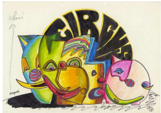
Michel Jaffrennou, storyboard d' Electronique Vidéo Circus (1984)