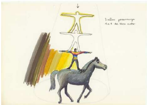
Michel Jaffrennou, storyboard d' Electronique Vidéo Circus (1984) - © Michel Jaffrennou / BnF