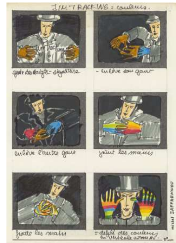
Michel Jaffrennou, Storyboard de Jim Tracking, le magicien de l'électronique (1986) - © Michel Jaffrennou / BnF