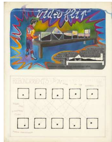
Michel Jaffrennou, Vidéo Flip (1980)