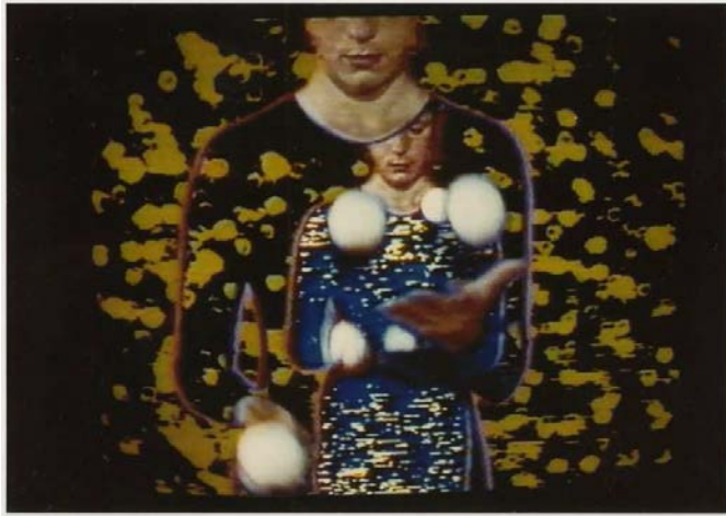
Electronique Vidéo Circus (1984) - © Michel Jaffrennou Centre culturel Georges Pompidou / Ville d'Orléans / BnF