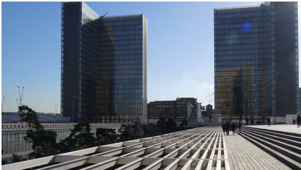
Bibliothèque nationale de France, site François Mitterrand

De sa conception à sa réalisation, la bibliothèque fut un terrain d'expérimentation permanent, suscitant de très nombreux débats, notamment autour du projet d'établissement – tardif dans le projet global et régulièrement modifié –, des coûts et du financement d'un si monumental bâtiment, des choix architecturaux – les circulations des documents et du personnels, le mobilier, le design intérieur.