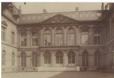
Eugène Atget, Bibliothèque Nationale, ancien Hôtel de Nevers. BnF, dpt. Estampes et photographie