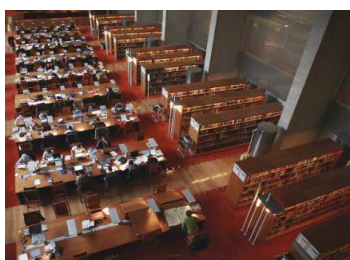
Salle de lecture de la Bibliothèque de recherche

La Bibliothèque nationale de France participe aux 35 èmes Journées européennes du Patrimoine sur le thème de « L'art du partage ». L'occasion de (re)découvrir par des visites ou des ateliers les coulisses et les activités de ses trois sites parisiens (François-Mitterrand, Richelieu, Arsenal) et de la Maison Jean Vilar à Avignon qui exposeront par ailleurs des pièces emblématiques issues des collections de la BnF, comme le Discours d'ouverture prononcé au Congrès de la Paix du 21 août 1849 par Victor Hugo, des portraits de petit format signés Félix Nadar ou des partitions manuscrites d'Olivier Messiaen.