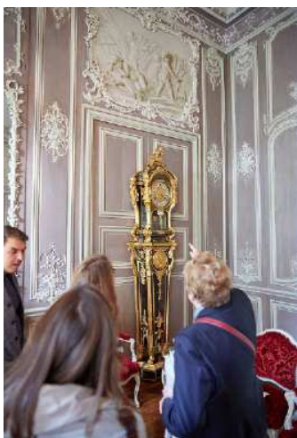
Salon de musique, BnF I Arsenal