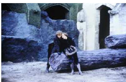
Don Carlos au Cloître des Carmes, Avignon, 1986. Mise en scène de Michelle Marquais