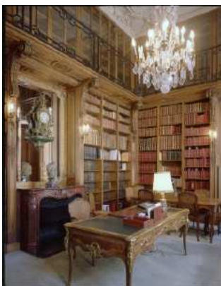
Bureau de la Présidente, BnF I Richelieu