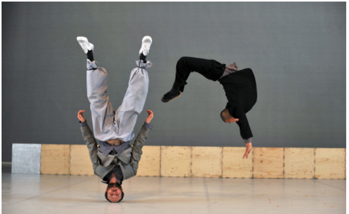
Sutra, chorégraphie de Sidi Larbi Cherkaoui, Photographies de Hugo Glendinning, 2009 © Hugo Glendinning