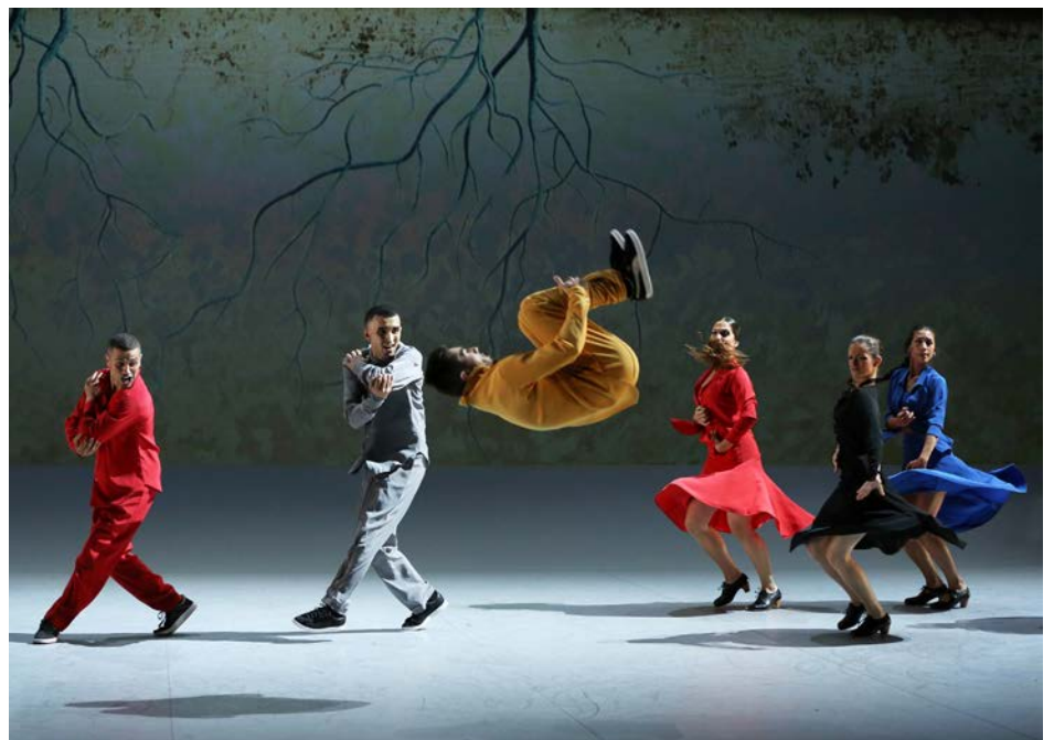
Y Olé ! chorégraphie de José Montalvo, Photographie de Patrick Berger, 2015 © Patrick Berger