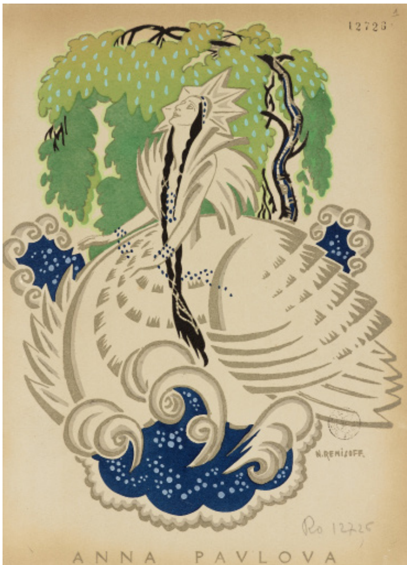
Anna Pavlova et les principaux artistes de sa troupe [...] maître de ballet : Ivan Clustine, Programme du palais du Trocadéro, illustré par Nicolai Remissov, juin 1921