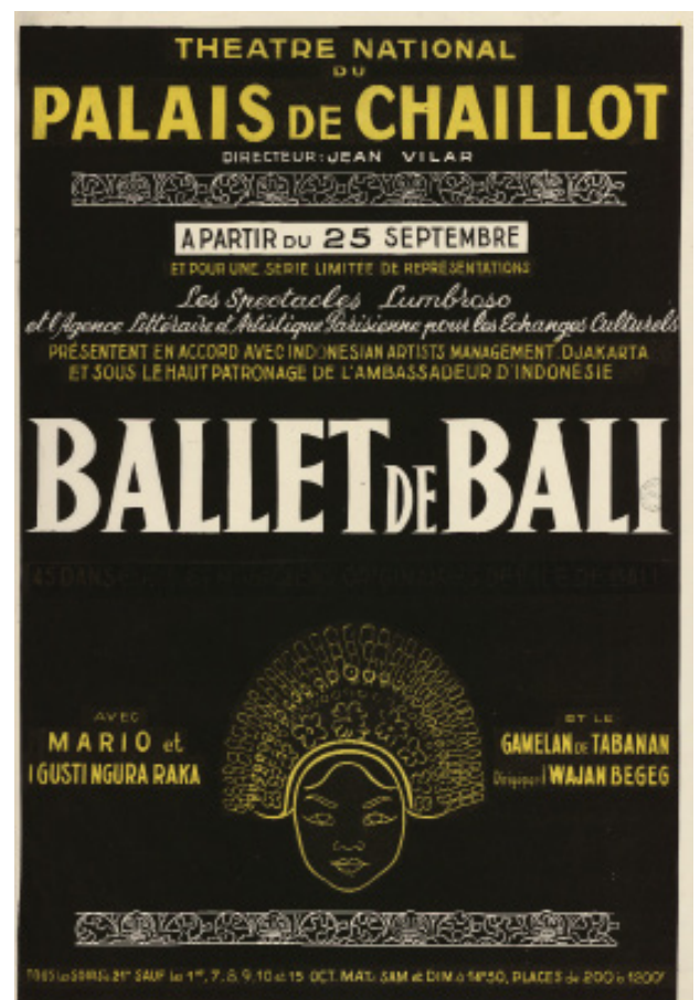
Ballet de Bali, Affiche du Théâtre national du palais de Chaillot, 25 septembre 1960