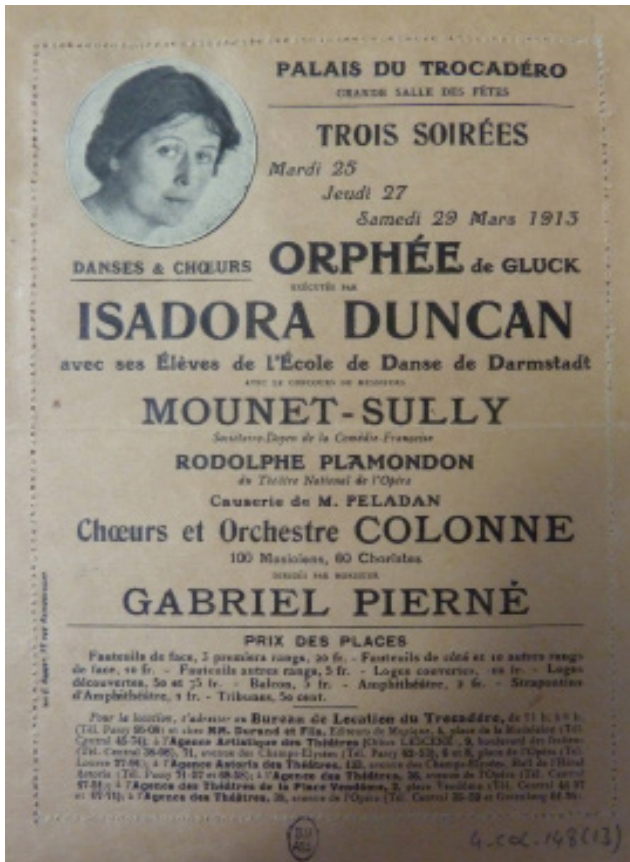
Orphée d'après Orphée et Eurydice de Gluck, danses et chœurs d'Isadora Duncan, Programme du palais du Trocadéro, 25, 27 et 29 mars 1913