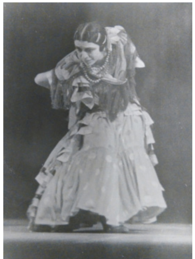
Argentina dans la « Danse du feu » de L'Amour sorcier , 1928, Photographie anonyme. BnF - Arts du spectacle © Droits Réservés