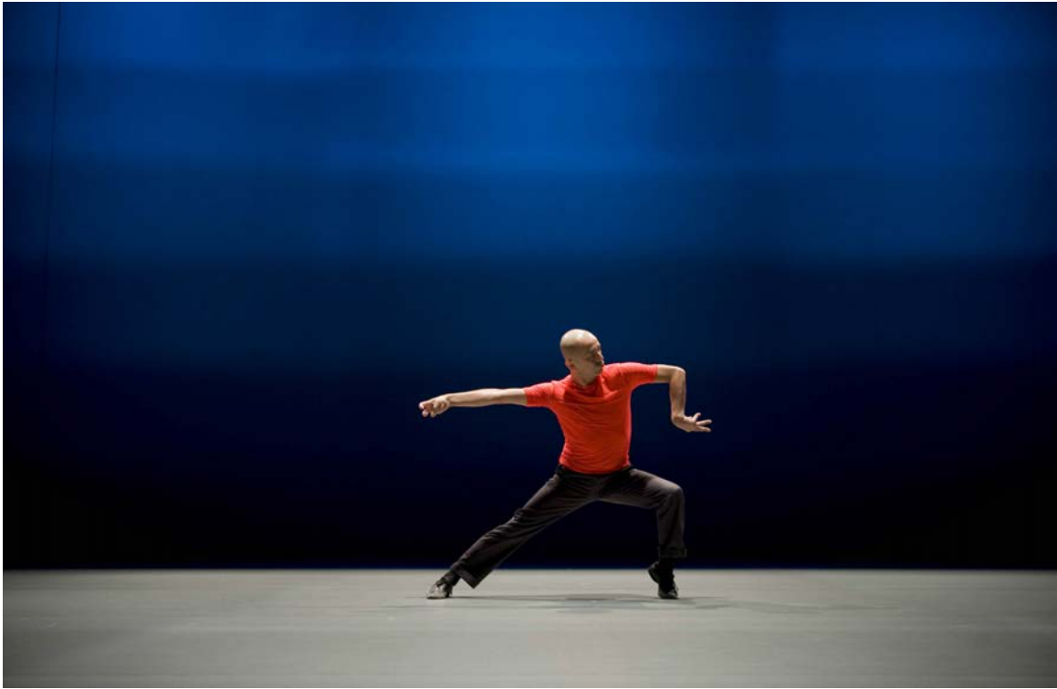
Miroku , chorégraphie de Saburo Teshigawara, Photographie de Bengt Wanselius, 2009 © Bengt Wanselius