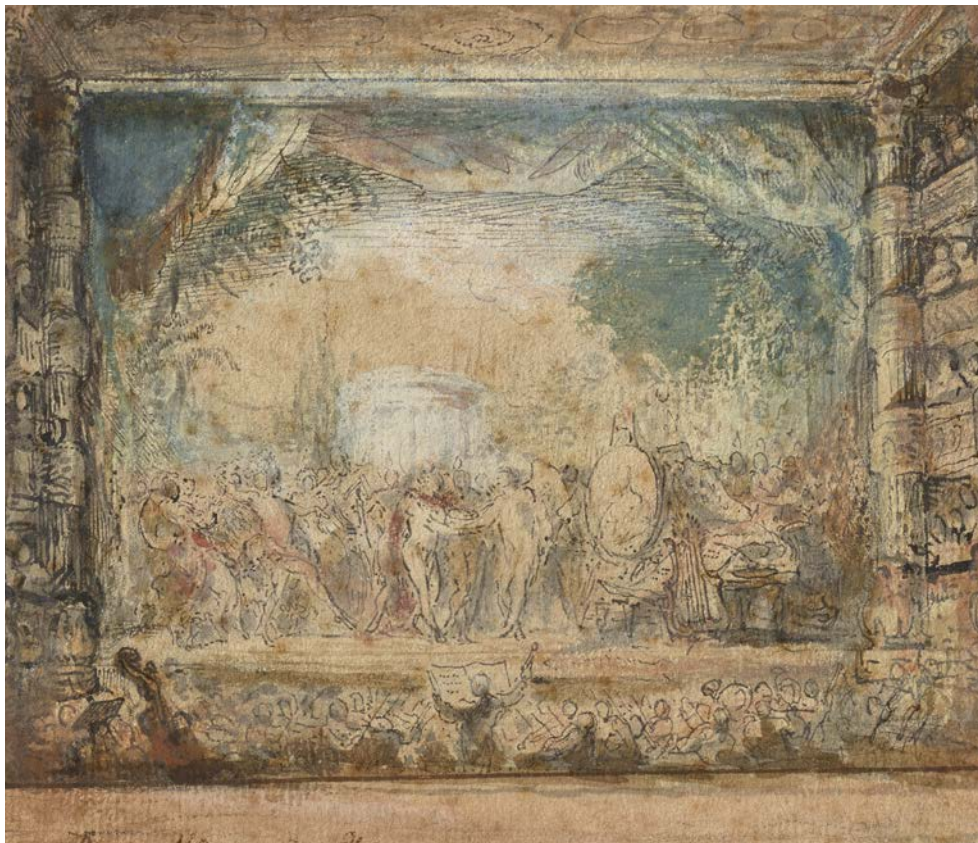
Gabriel de Saint-Aubin, L'Union de l'amour et des arts , [1773 - 1780], pierre noire, plume, aquarelle et rehaut de blanc, BnF, Musique