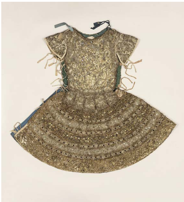
Tailleur des Menus Plaisirs du roi, Costume de ballet pour un danseur, brodé de fils d'or et d'argent, XVII e s., BnF, Musique, Bibliothèque-musée de l'Opéra