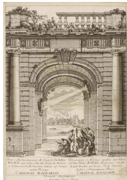
Israël Silvestre d'après François Francart, Décoration et machines pour les Noces de Thétis et Pélée , frontispice gravée, 1654, BnF, Arsenal