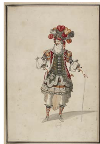
Jean Berain, maquette de costume du roi Égée dans Thésée de Lully, fin XVII e s., gravure aquarellée, BnF, Musique, Bibliothèque-musée de l'Opéra