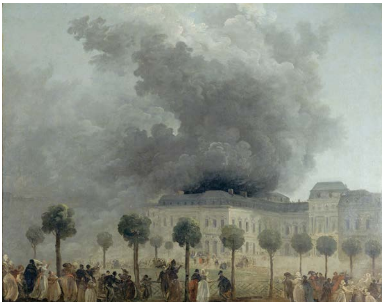
Hubert Robert, L'Incendie de l'Opéra, vu des jardins du Palais-Royal , vers 1781, Musée Carnavalet