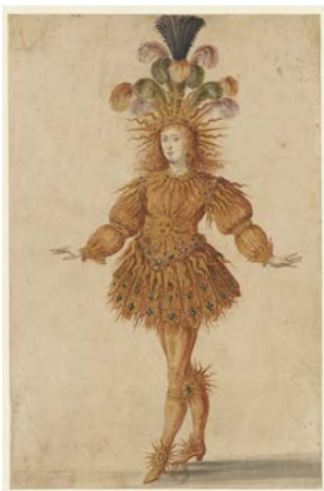
Maître du ballet de la Nuit, Costume pour le Soleil levant dans la dernière entrée du Ballet de la Nuit , 1653, Plume, lavis et gouache rehaussée d'or, BnF, Estampes et photographie

Iconographie disponible dans le cadre de la promotion de l'exposition de la BnF uniquement et pendant la durée de celle-ci. Pour les images provenant des collections BnF, toute publication supérieure à 5 visuels fera l'objet d'une redevance d'utilisation.