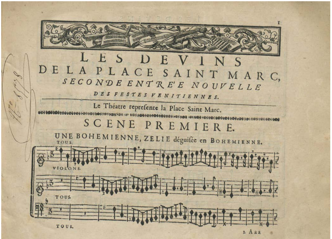
André Campra, Les Devins de la place Saint-Marc , seconde entrée ajoutée aux Fêtes vénitienes , 1710, partition imprimée, BnF, Musique