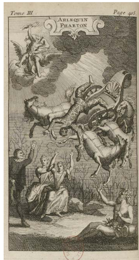
Jean de Palaprat, Arlequin Phatéon (1692), dans Le Théâtre italien de Gherardi , frontispice gravé, BnF, Musique, Bibliothèque-musée de l'Opéra