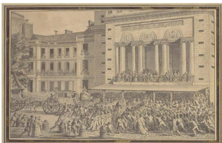
Jean-Louis Prieur, Le peuple faisant fermer l'Opéra le 12 juillet 1789 , entre 1789 et 1795, dessin, BnF, Musique, Bibliothèque-musée de l'Opéra