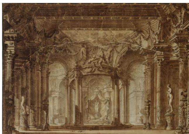
Charles de Wailly, Décoration du palais d'Armide, 1779, plume et lavis, BnF, Estampes et photographie