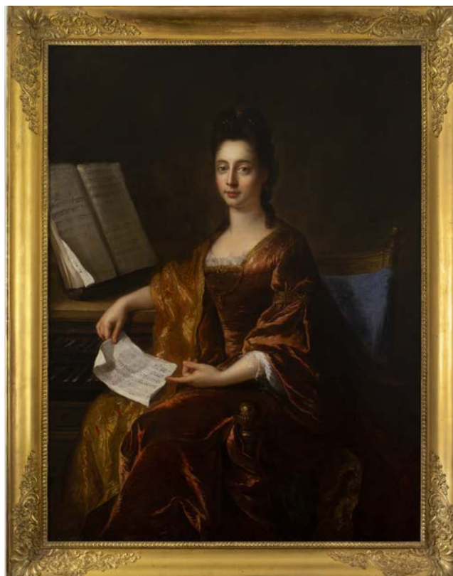
François de Troy, portrait présumé de Marthe Le Rochois, fin XVII e s., huile sur toile, collection Christophe Rousset