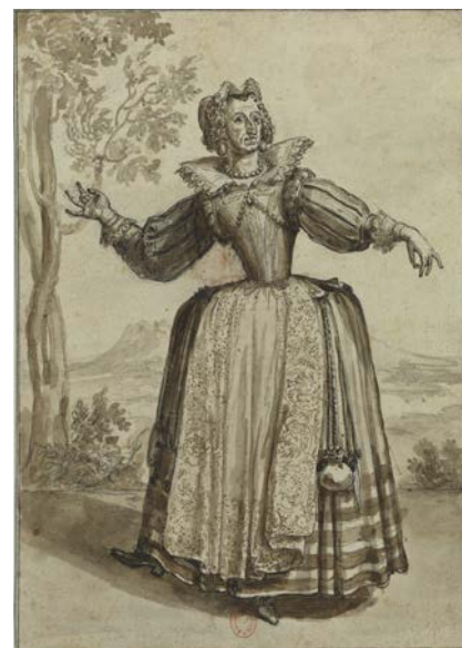
Henri II Bonnard, Dame Ragonde , entre 1698 et 1704, dessin, BnF, Estampes et photographie