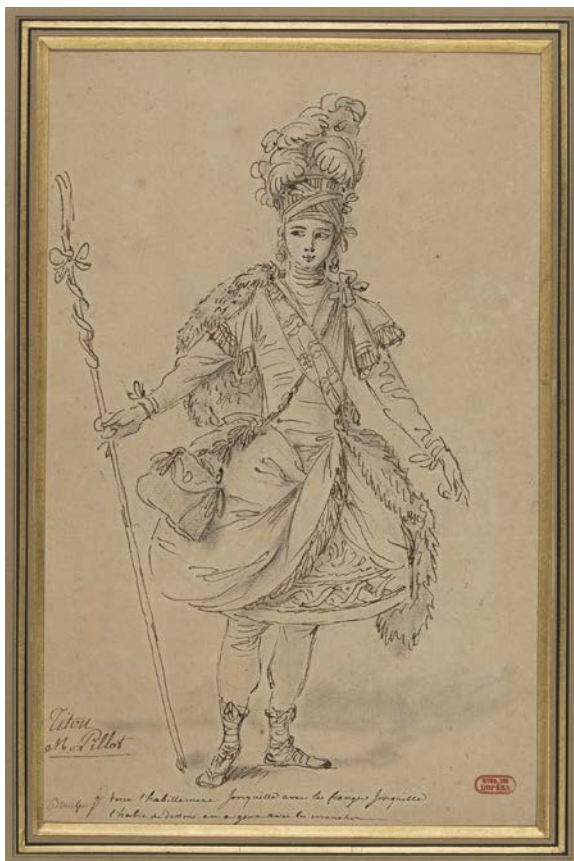
François Boucher, Titon dans Titon et l'Aurore , 1763, dessin, BnF, Musique, Bibliothèque-musée de l'Opéra