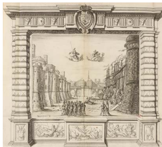
Attribué à Noël Cochin ou Nicolas Cochin d'après Giacomo Torelli, Décor du prologue de la Finta pazza de Saccati, 1645, planche gravée, BnF, Musique, Bibliothèque-musée de l'Opéra