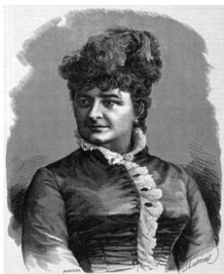
Emilia Pardo Bazán

Julio Cortázar, Rayuela et Queremos tanto a Glenda Pero López de Ayala, Rimado de Palacio Emilia Pardo Bazán, La Tribuna