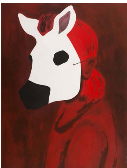
Françoise Pérovitch Nocturne 1 , 2017, Aquatinte en rouge et noir, 66 x 55 cm. Edition à 35 exemplaires imprimée à l'Atelier René Tazé. Editions MEL Publisher © Editions MEL Publisher

27 avril - 26 juillet 2020, BnF François-Mitterrand, galerie 1