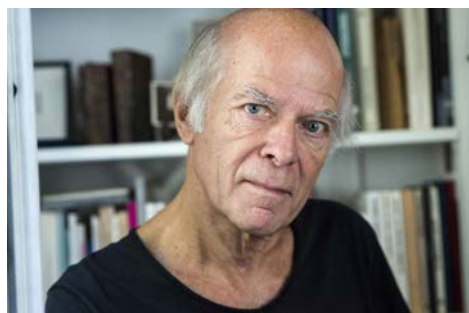
Pascal Quignard

8 avril - 7 juin 2020, BnFI François-Mitterrand, Galerie des donateurs