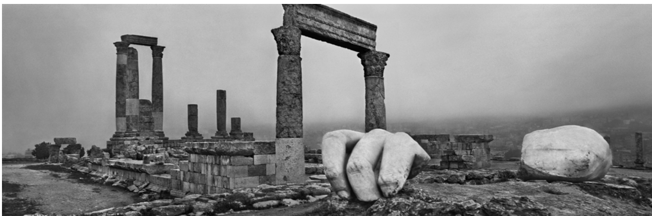
Amman. Jordanie. 2012.

21 avril - 19 juillet 2020, BnF François-Mitterrand, galerie 2