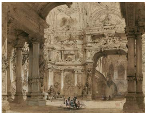
Charles-Antoine Cambon, Esquisse de décor pour Gustave III ou Le bal masqué de Daniel-François-Esprit Auber, 1833. BnF, Musique, Bibliothèque-musée de l'Opéra

24 octobre 2019 – 2 février 2020, BnFI Opéra, Palais Garnier