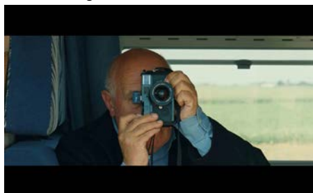
Raymond Depardon ©Palmeraie et désert 2012

On associe l'œuvre de Raymond Depardon à la photographie et au cinéma. L'attention aux images ferait oublier qu'il y a aussi la production d'un portrait sonore des lieux. C'est précisément le son dans le cinéma de Raymond Depardon qu'explore cette exposition. Des appareils (caméras, enregistreurs, micros...) illustrent l'évolution des techniques de prises de vues de Raymond Depardon ainsi que celles de prises de son de Claudine Nougaret, de l'analogique au numérique. Archives, photos de tournage et affiches documentent le parcours. Des extraits de films sont également projetés sur grand écran, dans une ambiance de salle de cinéma, témoignant de la manière dont la prise de son de Claudine Nougaret a influencé le cinéma de Raymond Depardon. A l'occasion d'une interview, les deux auteurs ont d'ailleurs commenté ce rapport entre l'image et le son, question aujourd'hui soumise à l'étude des linguistes du laboratoire CNRS d'Orléans. Par un jeu d'ondes sonores et de transcriptions présentées sur deux écrans, cette exposition invite le public à pénétrer au cœur de la matière sonore.