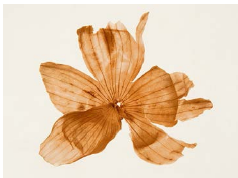
Denis Brihat, Pelure d'oignon , 2002 Tirage argentique, virage à l'or, 50 x 60 cm BnF, Estampes et photographie © Denis Brihat

8 octobre - 8 décembre 2019, BnFI François-Mitterrand, Galerie des donateurs