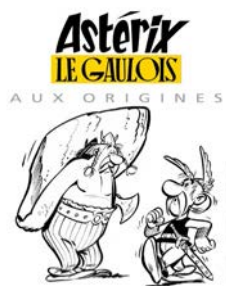
Exposition Bibliothèque nationale de France 20 / 22 septembre 2019

Les Aventures d'Astérix Le Gaulois sont une création de René Goscinny et Albert Uderzo ASTERIX ® OBELIX ® IDEFIX ® / © 2019 LES EDITIONS ALBERT RENE / GOSCINNY-UDERZO