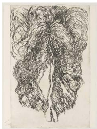
François Béalu. A corps et à cris pointe sèche. 76 x 56.8 cm. © François Béalu

23 juin - 23 août 2020, BnF François-Mitterrand, Galerie des donateurs