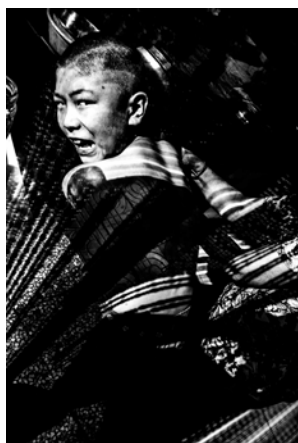
Tian Jin, Des fantômes de la république - L'homme invisible Bourse du Talent #21 © Tian Jin

20 décembre 2019 - 29 mars 2020, BnFI François-Mitterrand, Allée Julien Cain