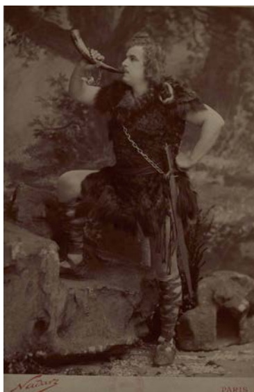
Jean de Rezké en costume de scène dans le rôle de Siegfried, par Nadar, 1902.