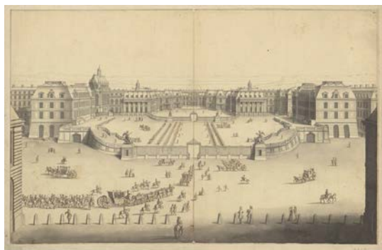
Château de Versailles. Vue et perspective du château du côté de l'entrée, [entre 1701 et 1788]. BnF, dép. Estampes et photographies