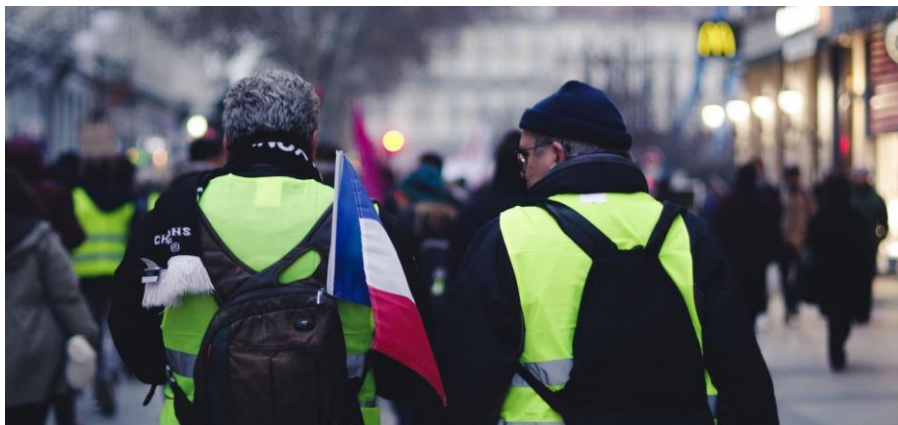
Des « Gilets jaunes »