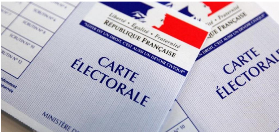
Illustration : cartes électorales