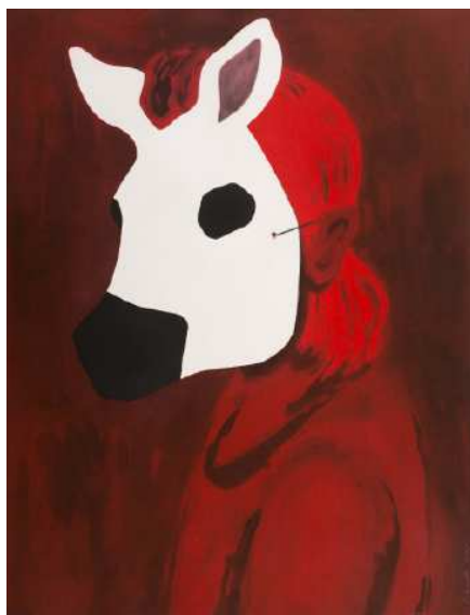
Françoise Pétrovitch. Nocturne 1 , 2017, Aquarelle en rouge et noir, 66 x 55 cm. © Editions MEL Publisher

30 mars - 11 juillet 2021, BnF François-Mitterrand, Galerie 1