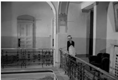
Chamber maid

15 avril - 7 juin 2021, BnF François-Mitterrand, Galerie des donateurs