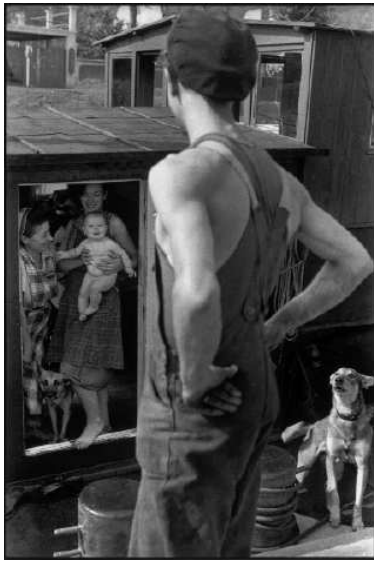
Henri Cartier-Bresson, Écluse à Bougival

13 avril - 22 août 2021, BnF François-Mitterrand, Galerie 1