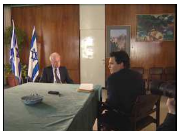
Interview d'Yitzhak Rabin par Amos Gitai 1993. © Amos Gitai.

16 mars - 7 novembre 2021, BnF François-Mitterrand, Allée Julien Cain