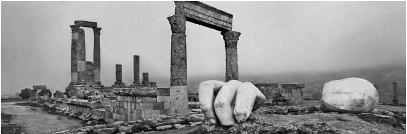
Amman. Jordanie. 2012.

15 septembre - 16 décembre 2020, BnF | François-Mitterrand, Galerie 2