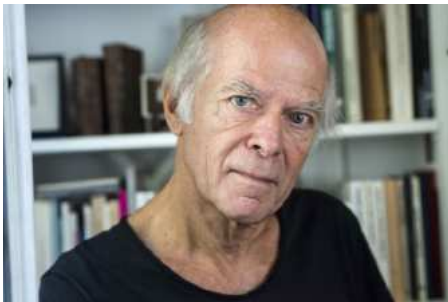
Pascal Quignard

30 septembre - 29 novembre 2020, BnF I François-Mitterrand, Galerie des donateurs