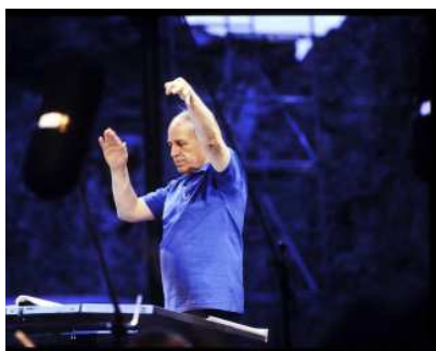
Recueil. Photographies. « Répons », musique de Pierre Boulez. Festival d'Avignon. 1988

12 janvier - 7 mars 2021, BnF François-Mitterrand, Galerie des donateurs