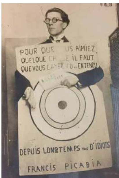
Anonyme, André Breton au Festival dada portant la cible dessinée par Picabia, 1920 dpt.des Manuscrits, BnF

17 novembre 2020 - 7 février 2021, BnF I François Mitterrand, Galerie 1