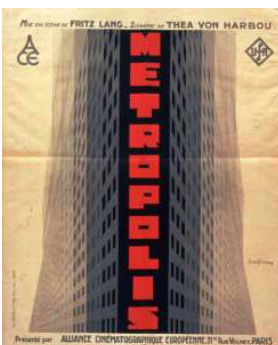
Métropolis, Bilinski, © BnF

22 septembre 2020 - 21 février 2021, BnF | François-Mitterrand, Allée Julien Cain