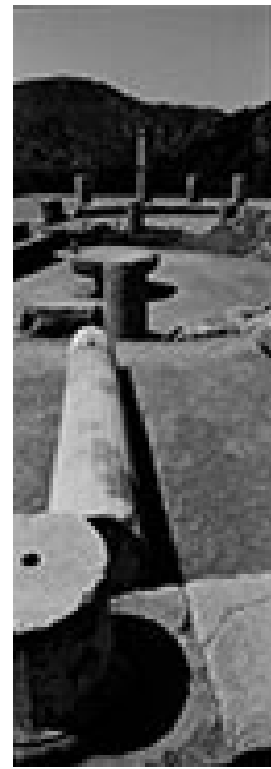
Caunos, Turquie, 2011