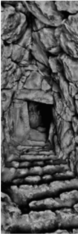
Mycènes, Grèce, 2003