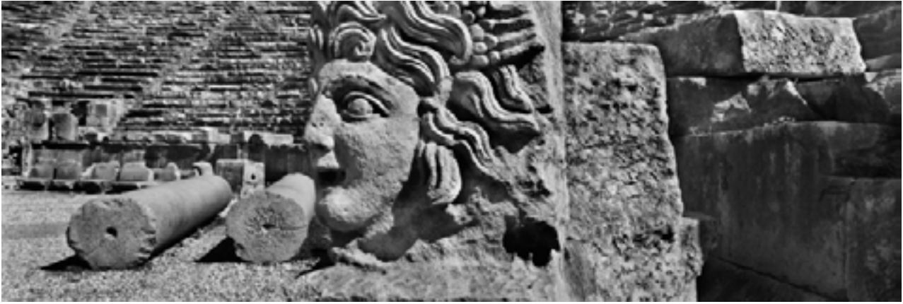
Myra, Turquie, 2013