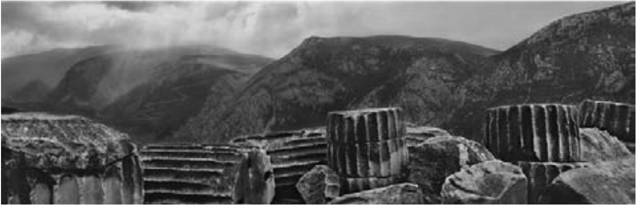
Temple d'Apollon, Delphes, Grèce, 1991