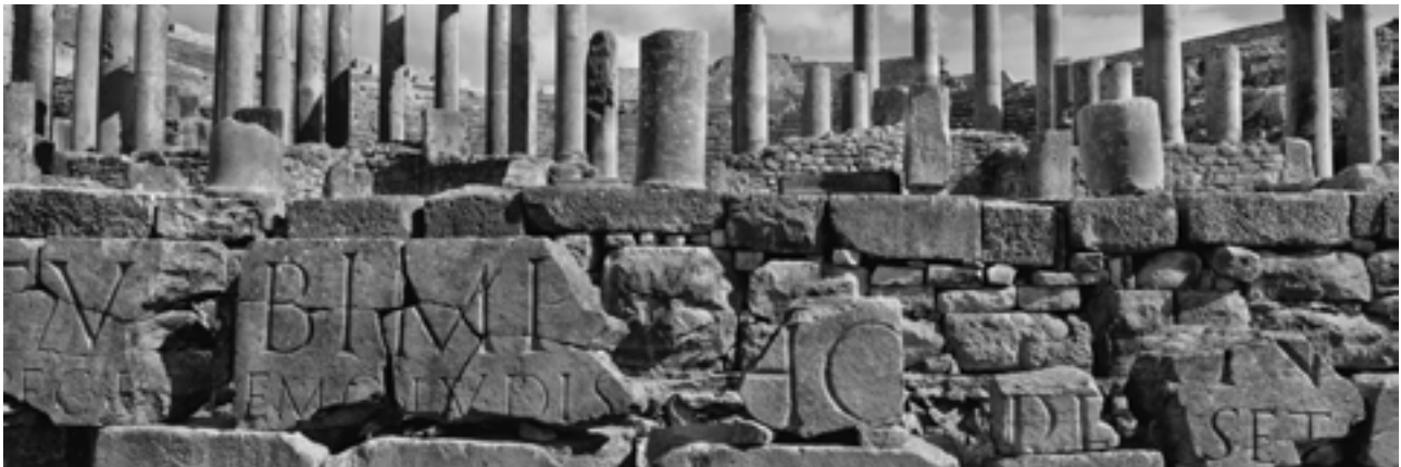
Thugga, Tunisie, 2011