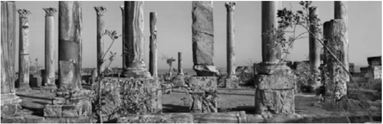
Apollonia, Libye, 2007