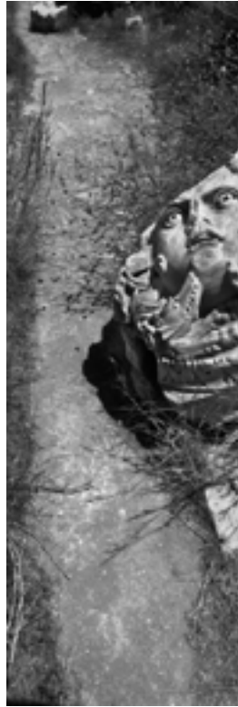
Leptis Magna, Libye, 2009