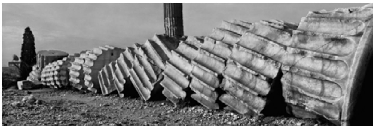
Athènes, Grèce, 1994