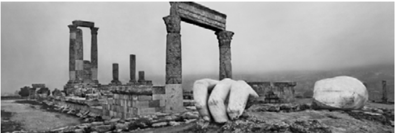
Amman, Jordanie, 2012