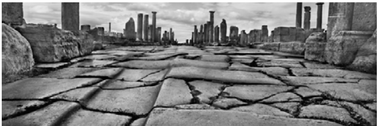
Timgad, Algérie, 2012