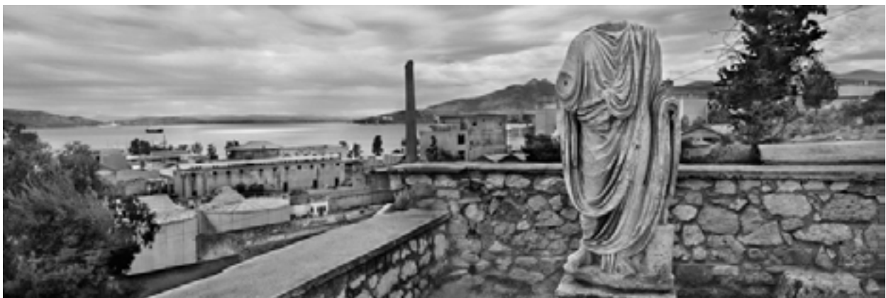
Éleusis, Grèce