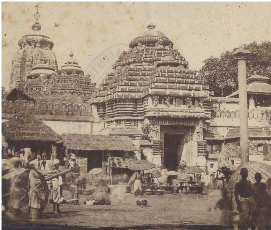
Porte principale de la pagode de Juggernaut. [Temple de Jagannath]. Inde (Orissa [Odisha]) in 71 phot. de vues et types divers de l'Inde, don G. Grandidier, Société de Géographie, 1928.