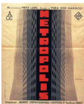
Métropolis, Bilinski, © BnF

22 septembre 2020 - 21 février 2021, BnF | François-Mitterrand, Allée Julien Cain