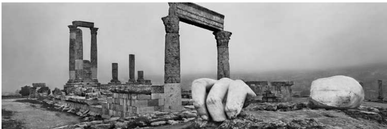
Amman. Jordanie. 2012.

15 septembre - 16 décembre 2020, BnF | François-Mitterrand, Galerie 2