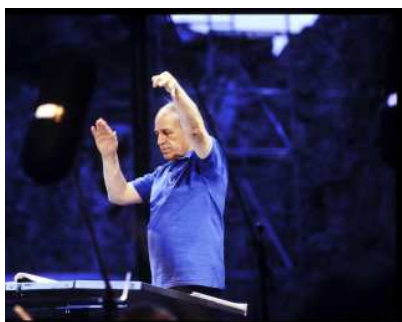
Recueil. Photographies. « Répons », musique de Pierre Boulez. Festival d'Avignon. 1988

12 janvier - 7 mars 2021, BnF François-Mitterrand, Galerie des donateurs