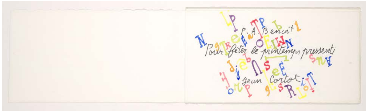
Pour fêter le printemps pressenti, Pierre-André Benoît. Graphie aquarellée de Jean Cortot, 1990. Paris, BnF, Réserve des livres rares. Jean Cortot © Adagp, Paris 2021