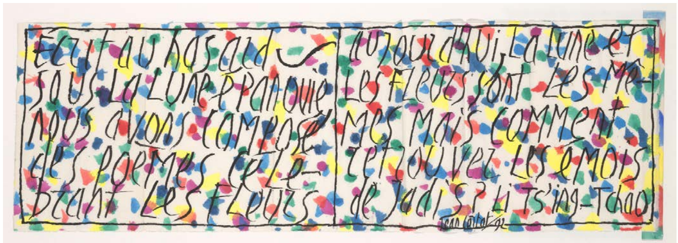
Fait au hasard, Li Ts'ing Tchao (1084-1155 ?), écrit et peint par Jean Cortot, 1992. Paris, BnF, Réserve des livres rares.