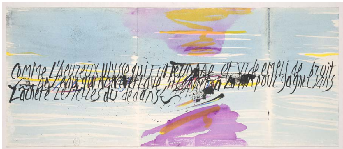
Chant pour Ulysse, Philippe Delaveau. Calligraphies de Jean Cortot et peintures originales de Julius Baltazar, 1992. Paris, BnF, Réserve des livres rares. Jean Cortot et Julius Baltazar © Adagp, Paris 2021