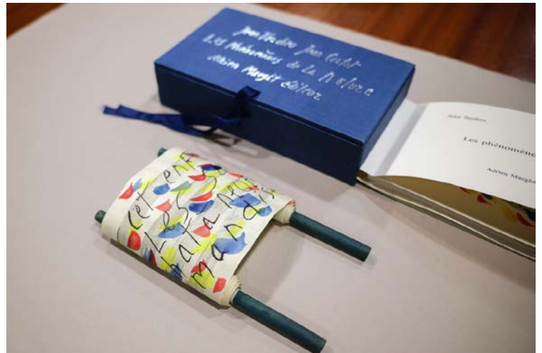
Les Phénomènes de la nature, Jean Tardieu. Lithographies et eau-forte rehaussée à l'aquarelle de Jean Cortot. Paris, BnF, Réserve des livres rares. Paris, A. Maeght, 1988. Jean Cortot © Adagp, Paris 2021