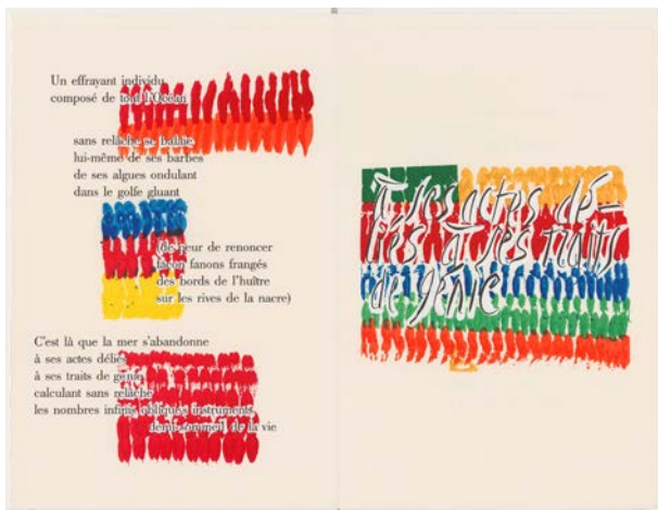
Petit bestiaire de la dévoration, Jean Tardieu. Lithographies de Jean Cortot. Paris, A. Maeght, 1991. Paris, BnF, Réserve des livres rares. Jean Cortot © Adagp, Paris 2021