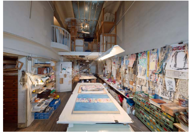
Atelier de Jean Cortot, 2019, Nicolas Pfeiffer pour Bébé Cortot © Adagp, Paris 2021