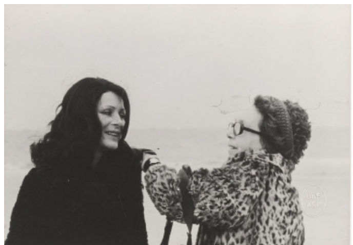
Catherine Sellers et Marguerite Duras pendant le tournage de La Femme du Gange de Marguerite Duras, 1972