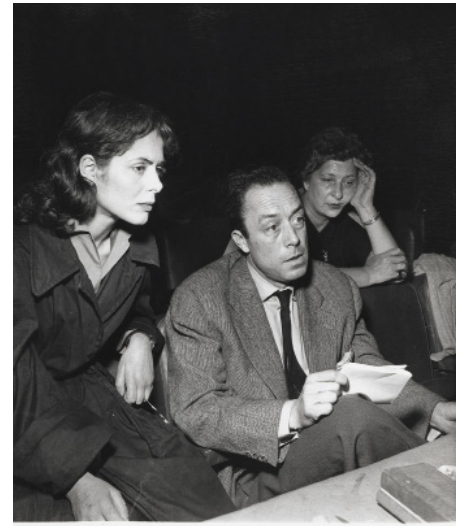
Catherine Sellers et Albert Camus lors d'une répétition de Requiem pour une nonne , 1956 © René Saint-Paul / Bridgeman Images BnF, Arts du spectacle