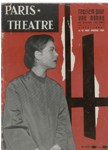
Couverture de Paris-Théâtre , n° 123, 1957