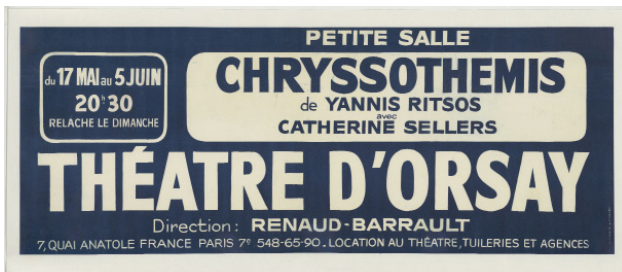
Affiche de la pièce Chrysothémis de Yannis Ritsos, 1975