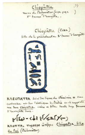
Copie par Champollion du nom de Cléopâtre, inscrit dans un cartouche BnF, département des Manuscrits © BnF