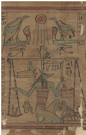
Papyrus mythologique de Tanytamon. BnF, département des Manuscrits