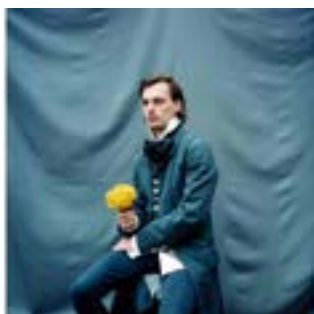
François & The Atlas Mountains

Le groupe pop francobritannique François & the Atlas Mountains propose une mise en musique de huit textes de Baudelaire, issus des Fleurs du Mal , parmi lesquels « À une passante », « Parfum exotique » ou encore « L'invitation au voyage ».