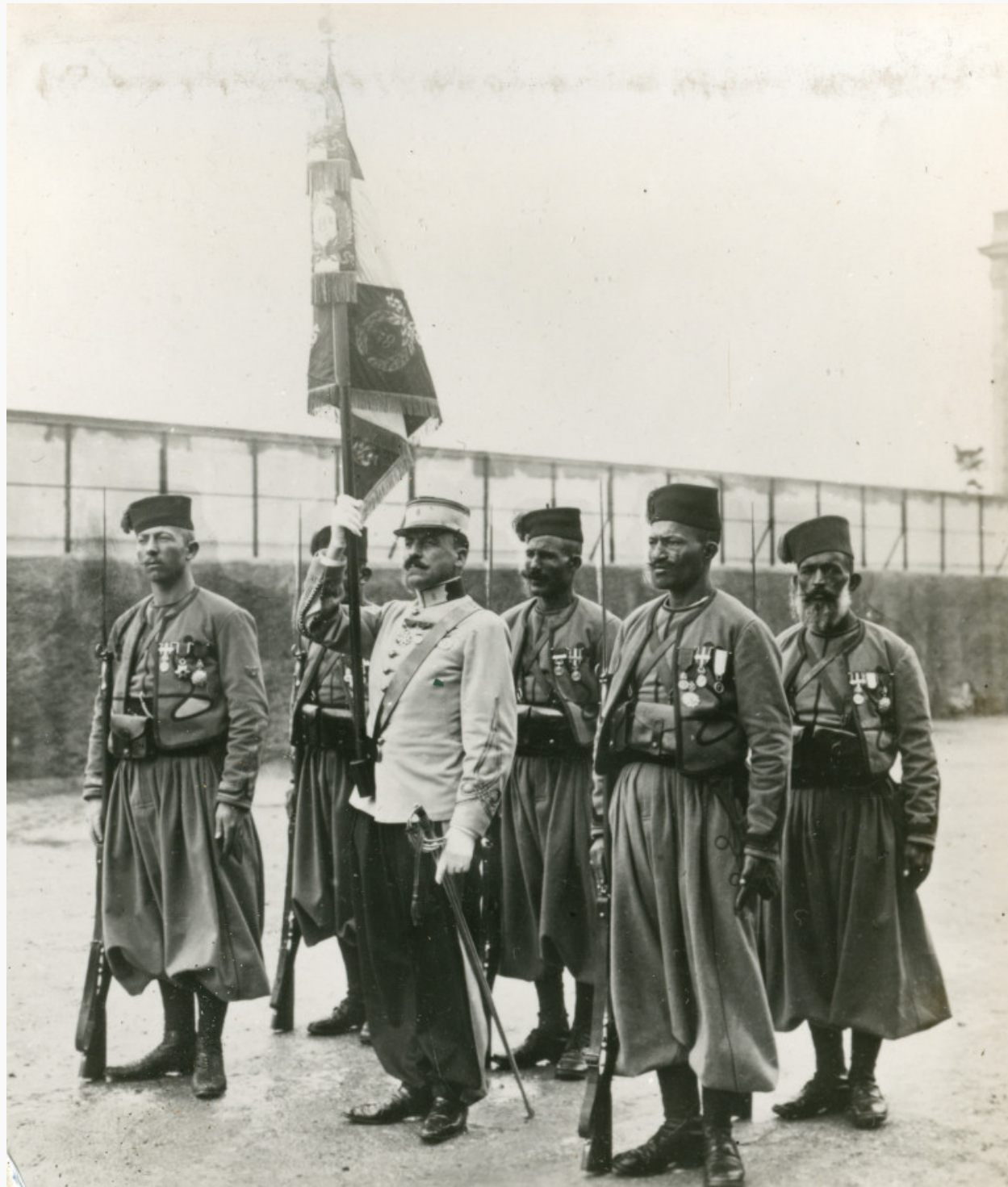
Photographie issue des fonds du Service historique de la Défense (Cote SHD GR 2 K 96 005)