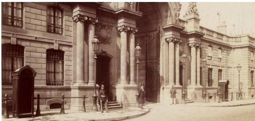
Ancien hôtel du Comte d'Évreux - 1718 : Palais de l'Élysée : (8e arr.) - Faubourg Saint Honoré.