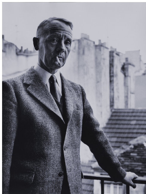
Julien Gracq, par Claudine Guéniot, vers 1970 © BnF, département des Estampes et de la photographie