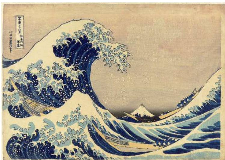
Katsushika Hokusai (1760-1849) Sous la vague au large de Kanagawa, vers 1831-1834

La cartographie de l'Asie et des Amériques au XVI e siècle offre un regard sur la fascination de l'Occident pour les terres lointaines et inconnues, tandis que l'étude des civilisations du Mexique révèle les identités culturelles de ce pays riche d'une histoire millénaire. L'arrivée en Chine des premiers missionnaires de la Compagnie de Jésus en 1582 marque les débuts de la sinologie en Europe, qui se développera grâce à des échanges de savoirs érudits. La fascination de l'Europe pour l'Égypte ancienne mène à la naissance de l'égyptologie avec le déchiffrement des hiéroglyphes par Jean-François Champollion, en 1822. De même, le mouvement artistique du japonisme naît à la fin du XIX e siècle de l'admiration pour l'esthétique et la culture japonaises. Enfin, le primitivisme au début du XX e siècle, puis les collaborations des surréalistes et des penseurs de la négritude et de la créolité, illustrent les échanges culturels et les influences mutuelles entre les civilisations.