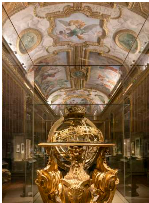
Galerie Mazarin © Mario Ciampi, avec l'aimable autorisation de Guicciardini & Magni architetti, Firenze