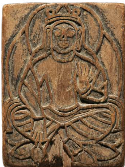
Matrice avec le bodhisattva Maitreya Près de Koutcha (Chine), VIII e siècle (?)

Lettres écrites d'Égypte et de Nubie en 1828 et 1829 par Jean-François Champollion