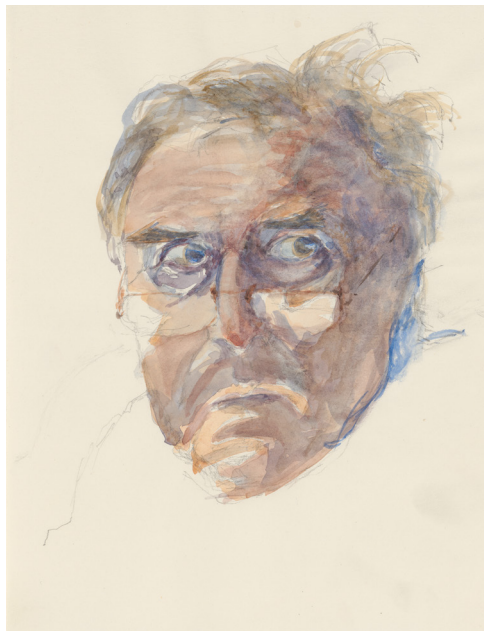
Henri Gaudin, Autoportrait , extrait d'un carnet BnF, Estampes et photographie