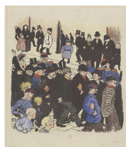
La rue : [estampe] / Félix Vallotton Source: Bibliothèque nationale de France

La vignette exportable permet d'intégrer facilement sur son propre site ou sur son blog une miniature d'une page de tout document consultable dans Gallica. Il suffit pour cela de copier-coller les lignes de code en HTML figurant dans la palette « Partager ». Sur le même principe, la sélection d'image exportable, accessible à partir du zoom de Gallica, permet de partager sur son blog un détail d'image.