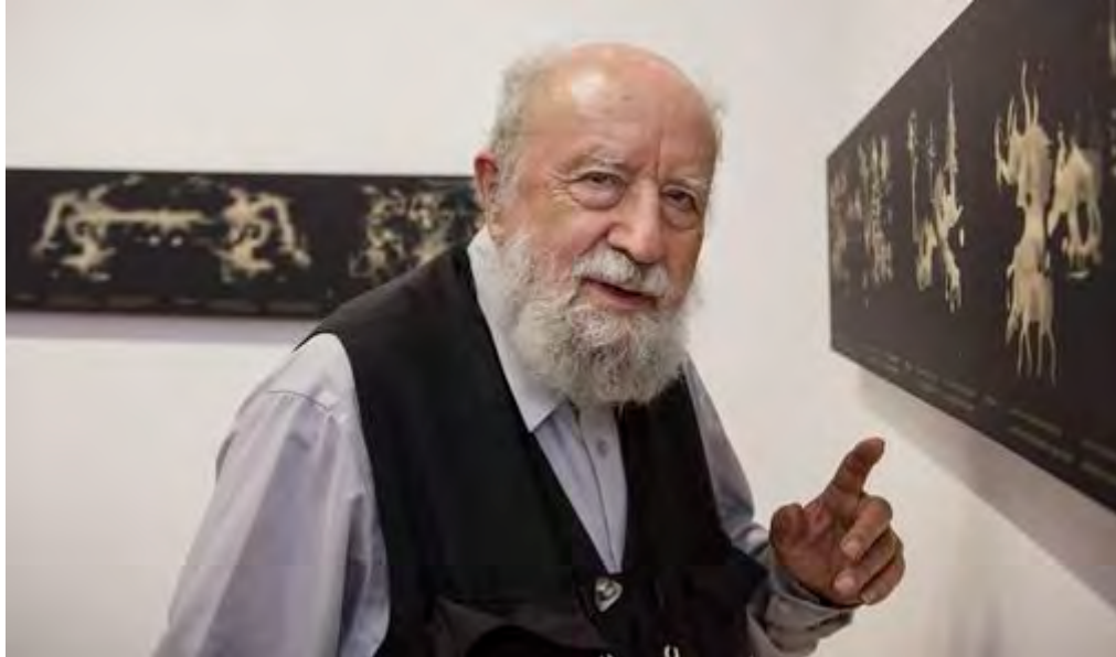
Michel Butor à la BnF en 2013

Michel Butor, dernière grande figure du Nouveau Roman mais aussi poète et essayiste, né le 14 septembre 1926, est mort mercredi 24 août à l'âge de 89 ans, laissant derrière lui une œuvre aussi monumentale qu'inclassable et protéiforme, très étudiée en France comme à l'étranger.