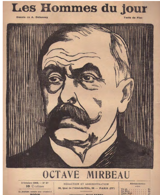
Les hommes du jour 03/10/1908. Dessin A. Delannoy

L'année 2017 marque le centenaire de la mort d'Octave Mirbeau, le 16 février 1917, jour de son 69ème anniversaire. Journaliste influent, critique d'art défenseur des avant-gardes, pamphlétaire redouté, Octave Mirbeau est aussi un romancier novateur, qui a contribué à l'évolution du genre romanesque, ainsi qu'un dramaturge à succès : Les mauvais bergers (1897), tragédie prolétarienne ou encore Les affaires sont les affaires (1903), retour à la grande comédie classique de mœurs. Après sa mort, il traverse pendant un demi-siècle une période de purgatoire : il est visiblement trop dérangeant, tant sur le plan littéraire et esthétique que sur le plan politique et social.