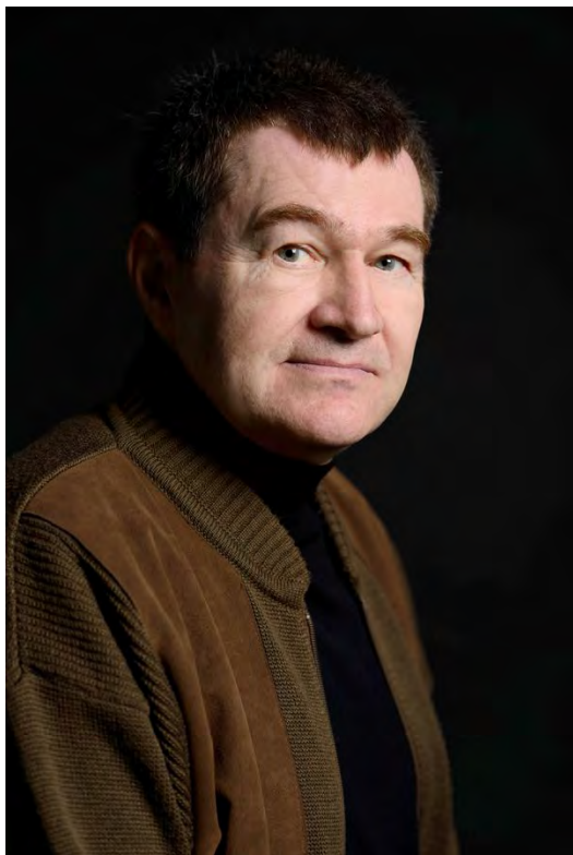
Antoine Volodine

Antoine Volodine, né en 1949, vient de se voir décerner le prix Médicis 2014 pour Terminus Radieux (Le Seuil, 2014). Cette distinction éclaire une œuvre majeure de la littérature de l'entre deux siècles, dans une continuité qui passe par Lautréamont, le Surréalisme, les littératures étrangères, notamment latino-américaines et russes, sans oublier ce que le philosophe Gilles Deleuze nommait les « littératures mineures ». Les romans de Volodine explorent de nouvelles formes d'un « art de raconter » tout en se déployant dans un imaginaire atypique.