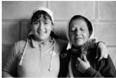
Sueños Compartidos © Thomas Sanchez