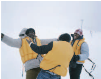
Black Snow © Joan Badeletti