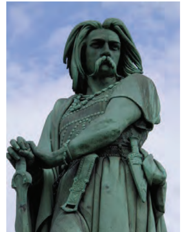
Colossal statue of Vercingetorix