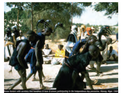
Hausa hunters at independence day celebrations in Niamey

En un plan-séquence de 9 minutes, Rouch unit comme personne le cinéma et la transe.