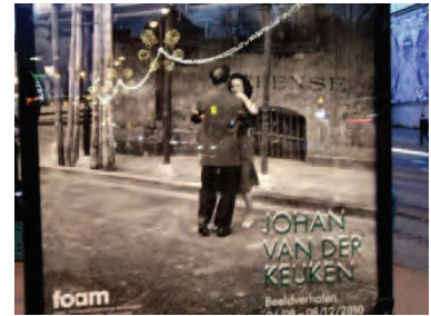
Johan van der Keuken FOAM Amsterdam reflectie

D'Amsterdam à Paris, le cinéaste Johan van der Keuken retrace son parcours. Quarante années d'un cinéma intime et social, entre engagement et épure. Le film glisse doucement des interrogations sur l'image aux souvenirs de jeunesse, de la théorie au portrait, de la force des formes à la présence acérée d'un regard.