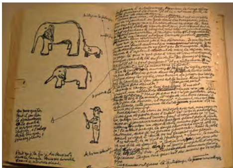
Édouard Glissant, Tout-Monde , collection privée