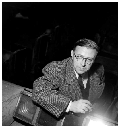
Boris Lipnitzki, Jean-Paul Sartre, Théâtre Antoine, Paris, 1946

De saisir quels regards elles ont posé sur les représentations, quelles interprétations elles en ont faites, et quels sont, finalement, les enjeux de ces photographies. Les cas choisis devraient permettre de mieux comprendre les principes majeurs qui sous-tendent toute la création photographique, dans les domaines les plus variés, du milieu du XIX e siècle jusqu’à nos jours.