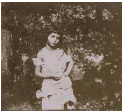
Lewis Carroll, Alice as a beggar child by Lewis Carroll 1859

Ce processus en reconnaissance n'a pas été facile, à une époque où la photographie était encore nouvelle et où il apparaissait clairement qu'elle allait bouleverser toute la tradition de création et de diffusion des images. Par leur principe de réalité et par leur qualité sérielle, les photographies posaient des problèmes jusqu'alors inconnus.