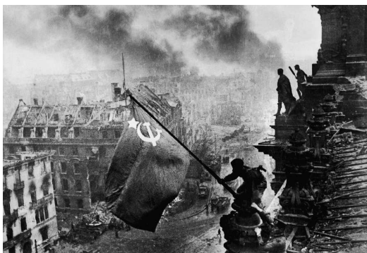
Evgueni Khaldei, Le Drapeau rouge sur le Reichstag , Berlin, 2 mai 1945

EVGUENI KHALDEI, Le Drapeau rouge sur le Reichstag , Berlin, 2 mai 1945