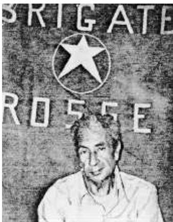
Anonyme, Aldo Moro after being kidnapped by Red Brigades , 1978 © Bettmann/Corbis/Specter Publication autorisée sur 1/2 page maximum