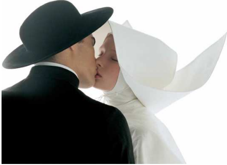
Oliviero Toscani, Kissing-nun , 1992

Avec des publications dans Elle , Vogue , Harper's Bazaar , Stern , Oliviero Toscani est connu comme photographe de mode. Mais c'est par sa collaboration de 1982 à 2000 avec Benetton qu'il acquiert une renommée mondiale. En dix-huit ans, il a construit pour la marque une identité très forte et contribué à sa notoriété. En 2000, Benetton est l'une des cinq marques les plus célèbres du monde et compte des magasins dans plus de cent vingt pays.