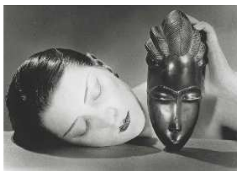
Man Ray, Noire et Blanche , 1926 © Man Ray Trust / ADAGP, Paris 2009 Publication hors couverture, 1/4 de page maximum