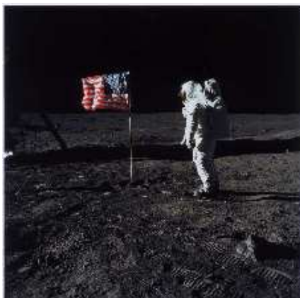
NASA, Buzz Aldrin on the Moon, July 20, 1969 © NASA, Washington, DR

Le 20 juillet 1969, Apollo 11 se pose sur la Lune. L'homme fait ses premiers pas sur le satellite terrestre devant des millions de téléspectateurs. L'image [...] marque durablement les esprits. Les mots saccadés de Neal Armstrong résonnent encore : « Un petit pas pour l'homme, un grand pas pour l'humanité ». Ces images, films et photographies marquent aussi la victoire éclatante de l'Ouest sur le bloc soviétique. Pourtant, près de quarante années plus tard certains contestent encore la réalité de cet évènement.