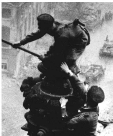
Evgueni Khaldei, Le Drapeau rouge sur le Reichstag , Berlin (Détail), 2 mai 1945

Pendant des décennies, l'image est publiée avec la retouche, une quelconque controverse risquant de mettre le feu aux poudres pendant la guerre froide. Finalement, après la chute du Mur de Berlin et l'effondrement du communisme, Khaldei réussit à publier l'image originale, dont il avait conservé le négatif intact, s'étant contenté de retoucher les tirages ou d'utiliser un contretypage de l'image officielle. [...]