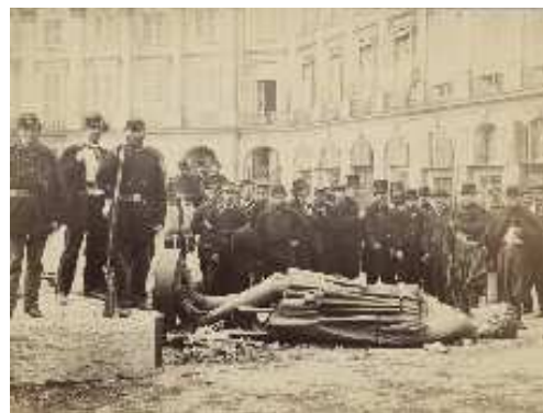
Bruno Braquehais, Commune de Paris, la colonne Vendôme à terre , 16 mai 1871 © BnF, département des Estampes et de la photographie