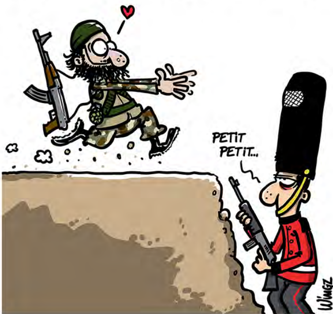
Wingz, L'Angleterre entre en guerre contre Daech Trophée pro 2016