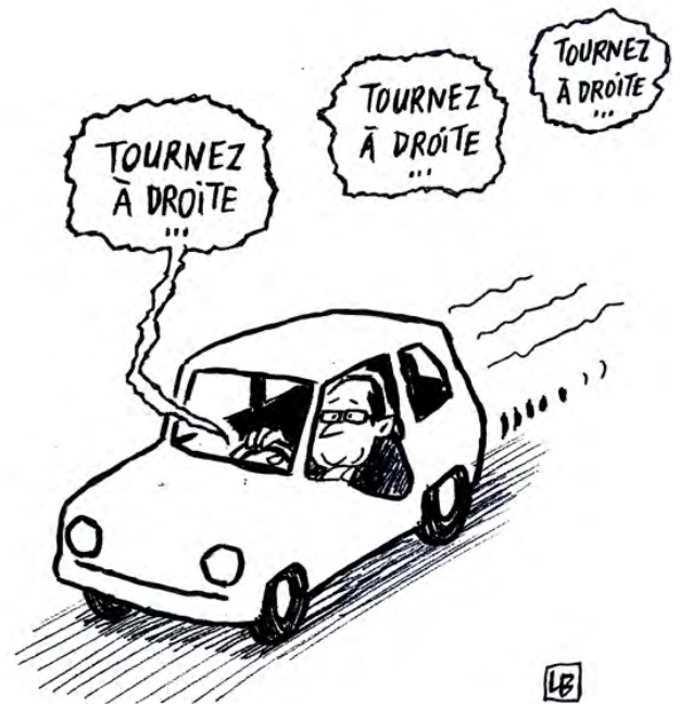
LB, Fast and furious , Trophée étudiant 2016