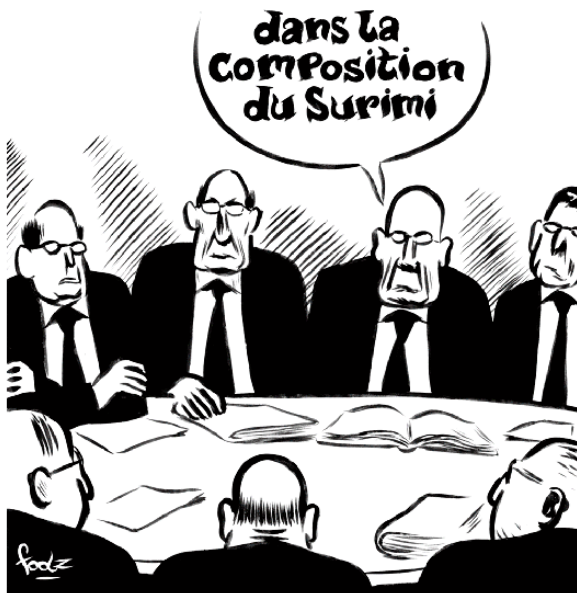
Foolz, Technocrates , Coup de cœur pro 2016